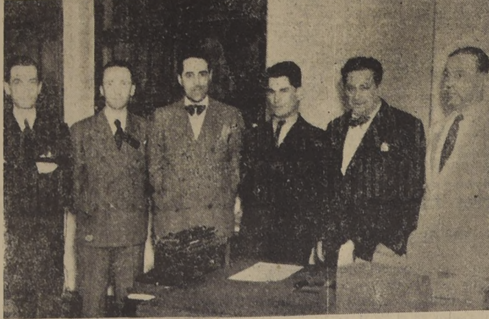
Miembros del Comité Directivo Pro Casa Propia

Se presentó un memorial a Caja de E.E. PP. y PP. con las aspiraciones más sentidas de los imponentes