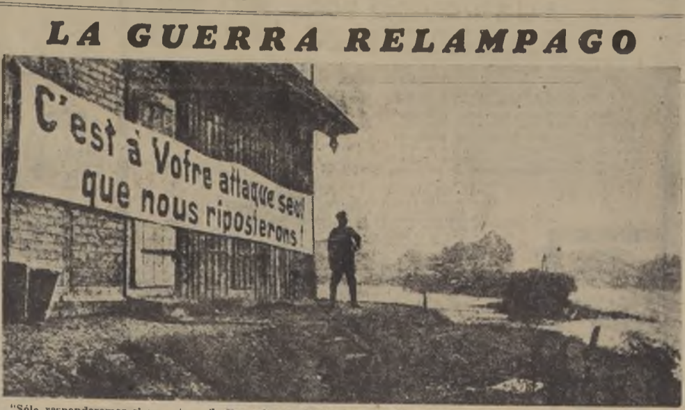
"Solo responderemos si nos atacan", dice este cartel colocado por los alemanes en la orilla derecha del Rin. Según informaciones cablegráficas llegadas ayer, no se ha cambiado de un solo disparo en este frente de 240 kilómetros.

Declaraciones del Subsecretario de Comercio de EE. UU., Mr. Noble