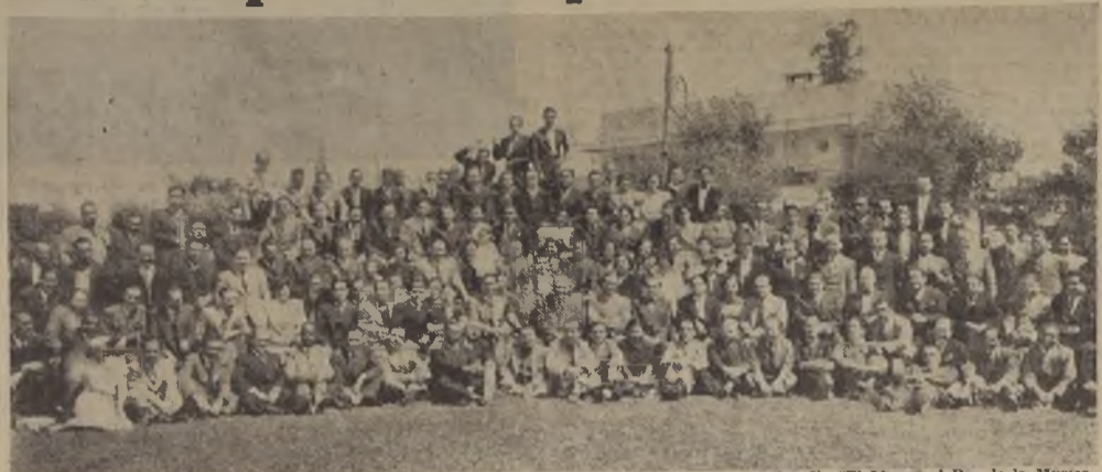
Grupo de asistentes a la competencia deportiva y banquete con que se celebró ayer en el Estadio "El Llano" el Dia de la Musica.