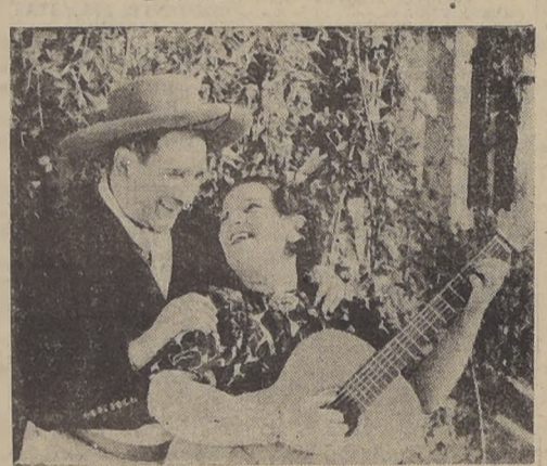
Una escena de ambiente criollo en la cinta "Dos corazones y una tonada".