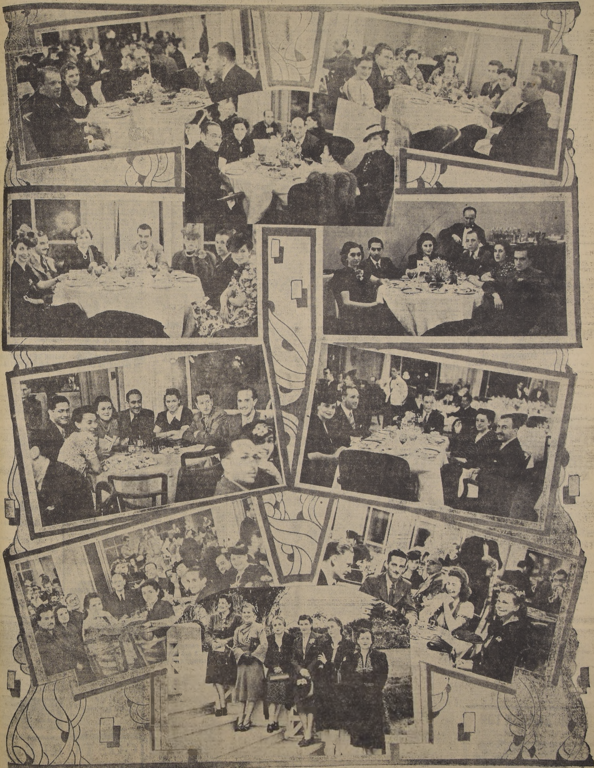
Nuevamente, lo mejor de nuestro mundo social y comercial, se ha dado cita en los salones del soberbio palacio del Casino Municipal de Viña del Mar. Las fotografías con que ilustramos esta página, dan nuevos aspectos de la numerosa y selecta concurrencia, que a diario llena sus salones, comedores y cabaret.