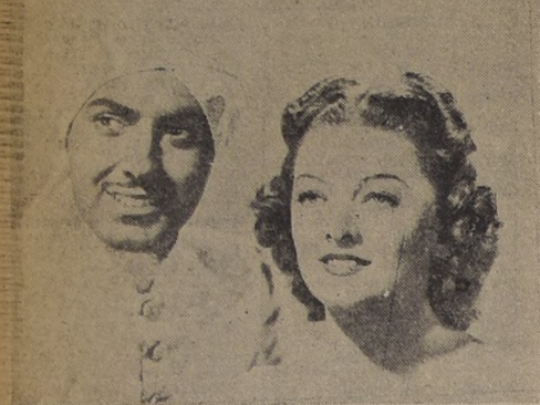
Tyrone Power y Mirna Loy en los principales roles de la novela de Bromfield, que estrenará la pantalla del Metro

El próximo miércoles, rompiendo la tradición de estrenar en días viernes, que tiene el Teatro Metro, presentará la primera para Chile de la superproducción 30th Century Fox, Llegaron las Lluvias.