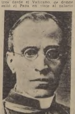
S. S. Pio XII

Tome hoy mismo una SUSCRIPCION ANUAL para el diario completo que es "LA NACION" Si usted paga hoy en nuestra Empresa su suscripción para el año 1940, además de enviarte gratis el diario por el resto de este año, le obsequiaremos una botella del exquisito licor de renombre mundial "CAZANOVE" VALOR DE LA SUSCRIPCION: $ 180.00.