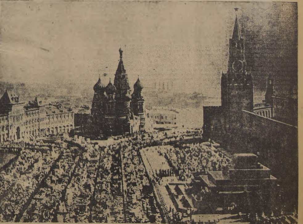
Sobre el Kremlin flota un misterio impenetrable, profundo. La Plaza Roja en un día de parada militar. A la derecha, en firme claro se ve la tumba de Lenin; el edificio con la torre del reloj es el Kremlin.

Después de las murallas del Kremlin hay muchos edificios: la iglesia de San Constantino, el palacio de Nicolás, el monasterio de Chudov, que es hoy día un cuartel militar, un convento, los tribunales de justicia, etc. En el interior, forma un cuadro que nunca olvidará el que lo ve una vez siquiera. Debajo de este emblema del comunismo internacional, un poco desaconsejadamente, es cierto, pues el cartílón fué hecho para que tocara "Dios Salve al Zar" y jamás se le ha arreglado en forma que loque la Internacional como es debido.