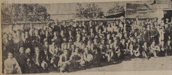
Asistentes a la manifestación que se llevó a efecto el sábado último, en la Quinta "La Chilena".