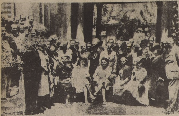
Manifestación ofrecida ayer en la Legación del Paraguay por la delegación de médicos de ese país al Congreso Latinoamericano de Hospitales, a sus colegas chilenos para retribuir las atenciones de que estos los han hecho objeto durante su permanencia en Santiago.