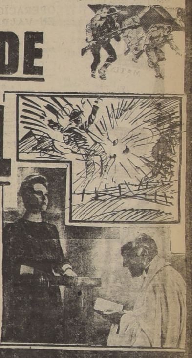
Ambas representaciones de hoy son precedidas de dos películas: "Fiestas de mi Patria" y "México canta".

Un drama demasiado intenso para ser descrito en palabras, hechos reales que conmueven poderosamente y que relatan un doloroso suceso, con tanta maestría, que constituye el espectáculo de mayor relieve hecho en años.