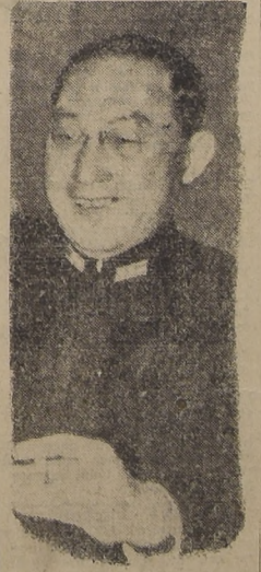
El amigo de las democracias y enemigo de los totalitarios, que es el nuevo Premier del Japon.