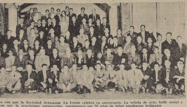
Asistentes a la asamblea solemne con que la Sociedad Artisanos La Unión celebró su aniversario. La velada de arte, baile social y demás festividades con que la prestigiosa corporación conmemoró sus 78 años de labor resultaron brillantes