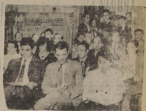
Un aspecto de la sesión inaugural

Asisten delegados de esta capital y de varias ciudades. Estudiará los problemas que afectan al gremio y sus soluciones