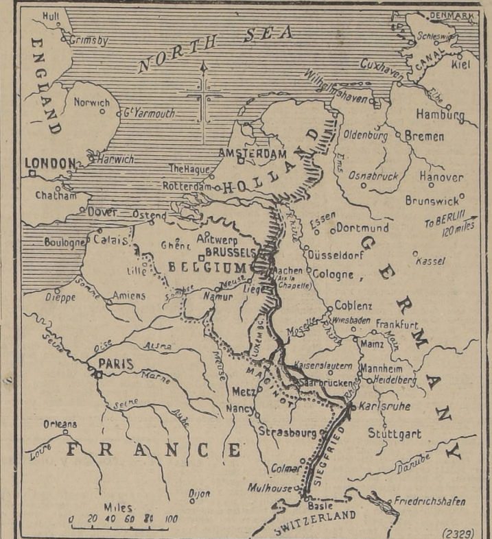
La parte achurada indica las fronteras, en donde reside el peligro para las pequeñas naciones belga y holandesa. Frente a Holanda hay 18 divisiones alemanas, y frente a Bélgica, 41.