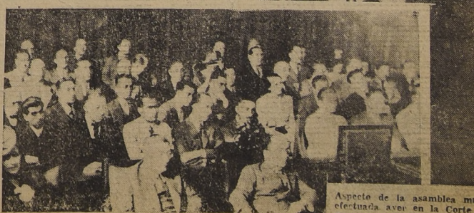
Aspecto de la asamblea magna efectuada ayer en la Corte Suprema, con motivo de la apertura del Año Judicial.

MEJOR REVISTA POLITICA... MEJOR COMO NUNCA... MATERIAL... no izquierdistas, en el movimiento pro de Arturo Herrera... en la y luego los... error político de la... al lanzarse en... el Frente Popu... ted quienes son todo... Xirgu, cinda terne... tora en las Cortes... erencia Finlandesa, es... en Argentina, y po... Cuba y en Perú... documentada infor... política nacional... stas, análisis y co... internacionales sobre... ra, China los Pa... andinavos, Estados... artículos, notas; etc... los mejores es... chilenos... LIBRO PRENSADO... CIRCUNSTANCIAS... A SU PRECIO... DIO $ 1.40