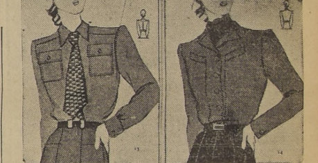
13.—Blusa en franela lavable, gris, cuello, puños y piezas superpuestas subrayadas por espesuras: Se precisan 2 metros.