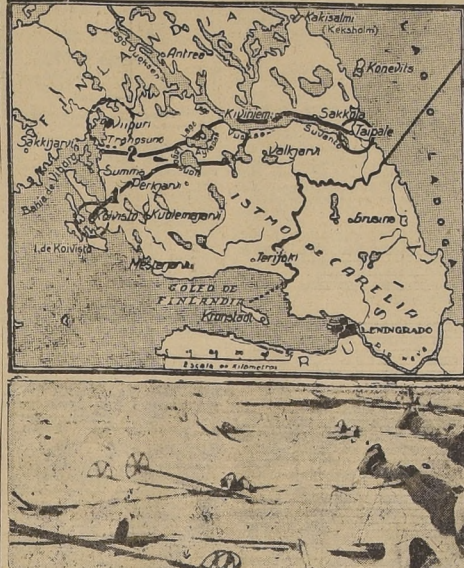
Sobrepasa la primera Línea Mannerheim en la parte marcada en el mapa con el No. 1 y retirados los finlandeses de los fuertes de la ciudad y de la isla de Koivisto, marcados con un círculo, los rusos se avanzaron contra la segunda línea de defensas (No. 2), en demanda del puerto de Viborg (Viipuri en fines). Las últimas informaciones del cable hablan de que han circulado rumores según los cuales los rusos habrían entrado a los suburbios de la ciudad, pero éstos han sido desmentidos por Helsinki, que afirma: "Los rusos están a varios kilómetros"; a 2, asegura la última información procedente de Estocolmo.

2.º—La Corporación de Fomento podrá arbitrar los medios para realizar, si en el futuro fuere necesario, la reaserradura, secamiento artificial y elaboración de la madera en los puntos del país que estime conveniente.