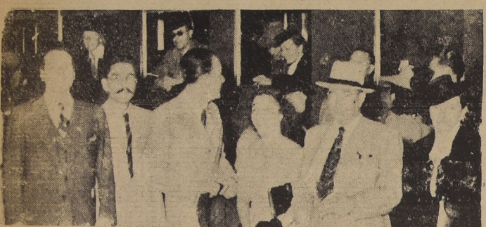
Ayer a las 20 horas, partió con destino a Buenos Aires para continuar viaje a Montevideo, la delegación de arquitectos que representará a Chile en el Congreso Panamericano de Arquitectura que se efectuará...