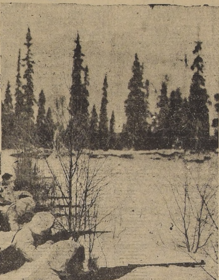
El movimiento envolvente destinado a rodear las posiciones finlandesas al N. del lago Aeyraepaen se ha estrellado contra la línea Vuoksi-Suwanto