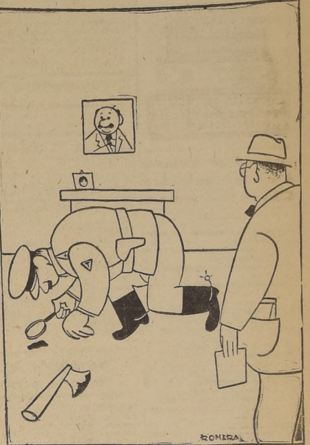
—¿Investigando, mi carabinero? ¿Y los detectives? —Están muy ocupados firmando querrelas contra los diarios.