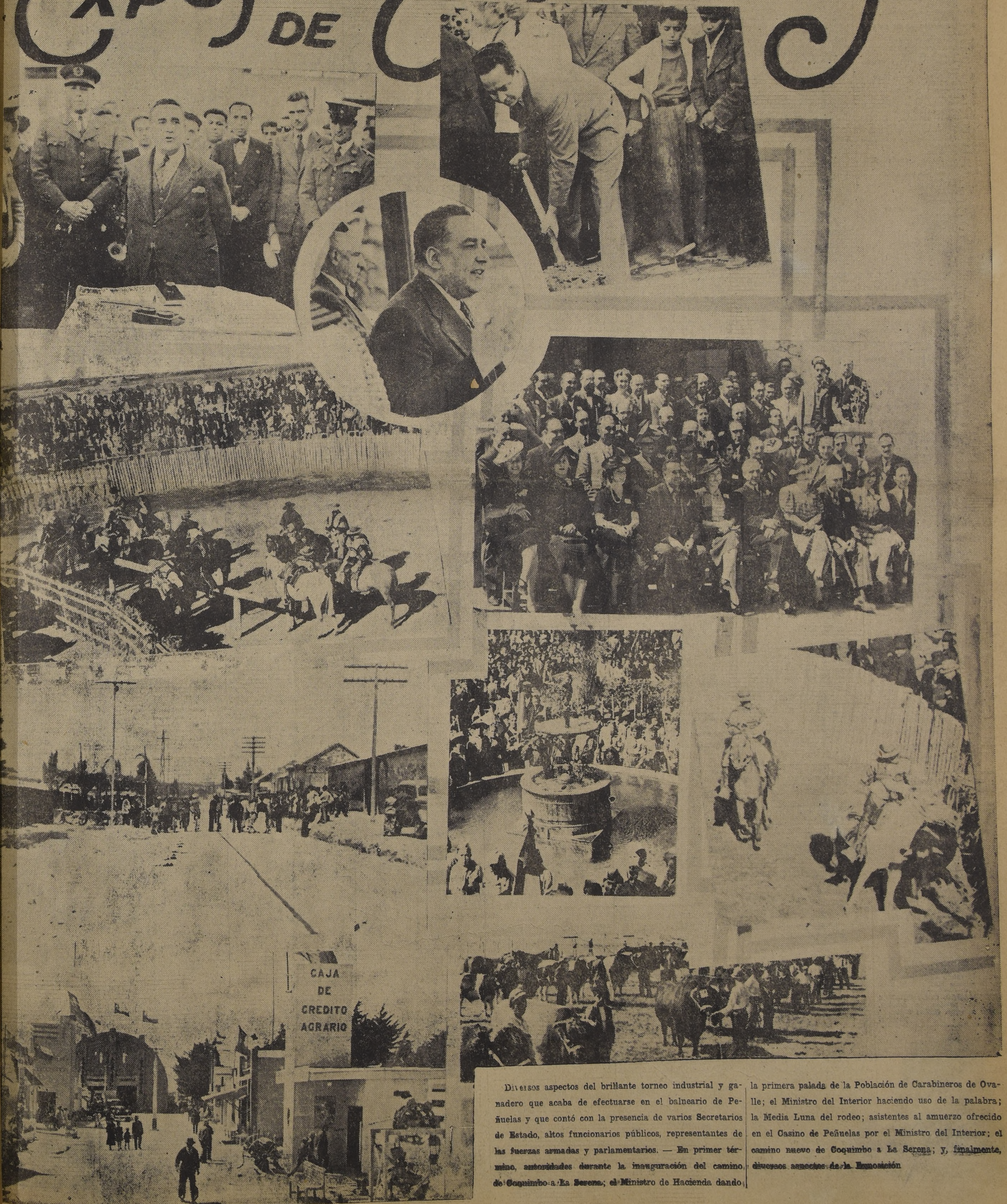
Diversos aspectos del brillante torneo industrial y ganadero que acaba de efectuarse en el balneario de Peñuelas y que contó con la presencia de varios Secretarios de Estado, altos funcionarios públicos, representantes de las fuerzas armadas y parlamentarios. — En primer término, autoridades durante la inauguración del camino de Coquimbo a La Serena; el Ministro de Hacienda dando