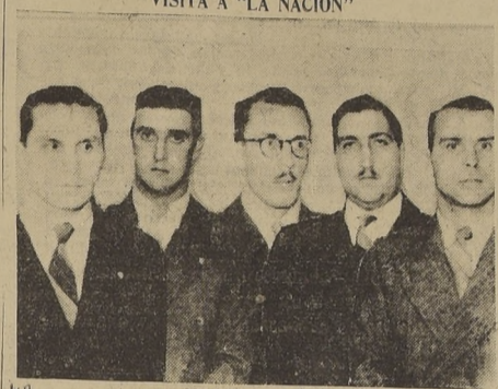
Visita a "LA NACION" de la delegación de estudiantes peruanos que nos visitó ayer

Viene en misión de confraternidad. — Pulsará el ambiente para idea de celebrar un Congreso Estudiantil Americano y para el intercambio de Estudiantes