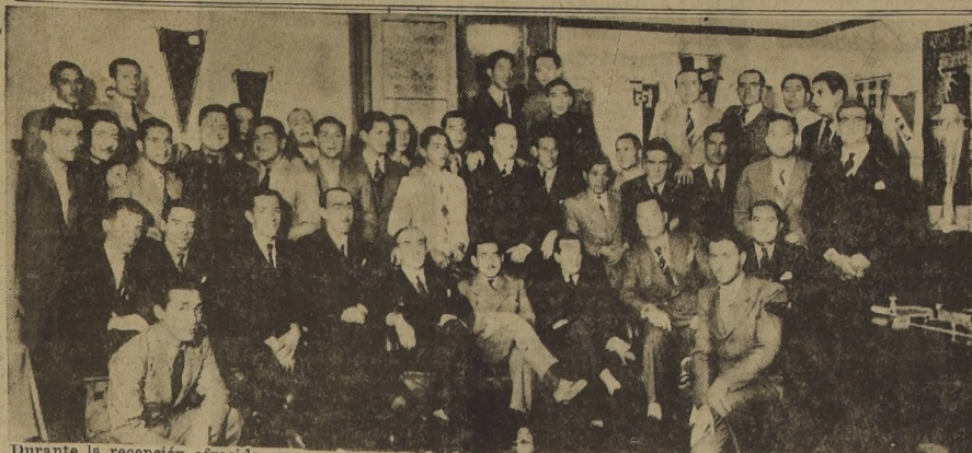
Durante la recepción ofrecida ayer en la secretaria del Colo Colo a los miembros de la delegación peruana del Club Universitario

EN HONOR DE LOS PERUANOS En la tarde de ayer, la Directiva de Colo Colo recibió oficialmente a la Delegación peruana, ofreciéndoles con este motivo una copa de champán.