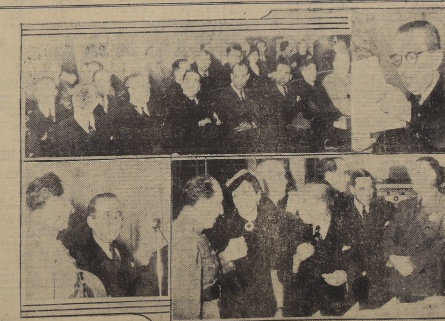
Durante la sesión solemne y el cocktail ofrecido ayer en la Municipalidad de Santiago en honor de la delegación mexicana