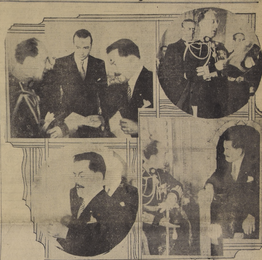
Aspectos de la brillante ceremonia que motivó el acto de la presentación de credenciales del Excmo. señor Ignacio M. Beteta como Embajador Extraordinario en misión especial, efectuado a mediodía de ayer en el Palacio de la Moneda

gimiento de Cazadores y a su erribo a la Moneda le rindió los honores protocolares el Regimiento Buin con su Banda de Música. La tropa presentó armas y la banda ejecutó una marcha militar. La Guardia de Carabineros del Palacio de Gobierno presentó armas, mientras el Embajador Beteta y acompañantes entraban al Palacio Presidencial momentos en que la numerosa concurrencia estacionada en los alrededores de la Moneda los aplaudía y vivaba a México y su Presidente Excmo. señor Cárdenas.