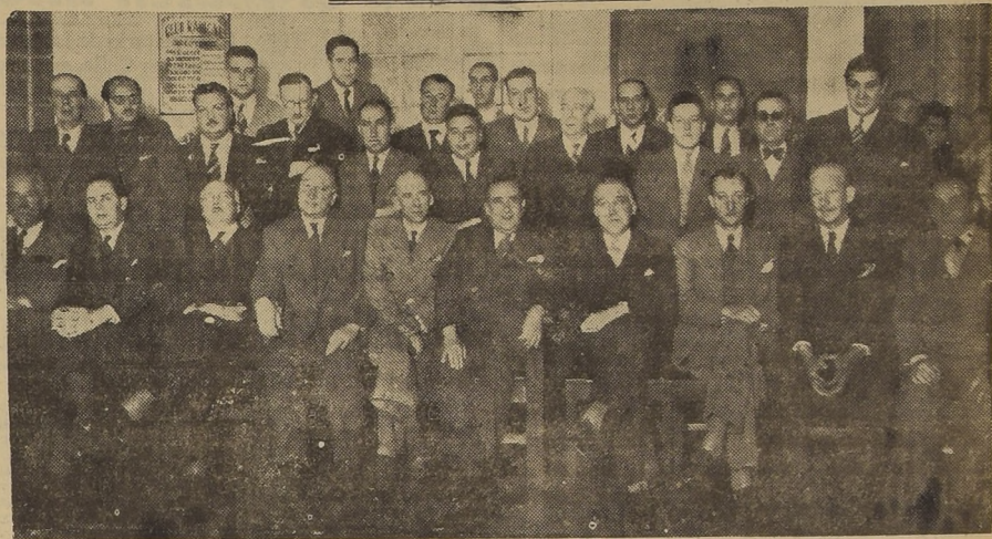
Una parte de los asistentes a la manifestación ofrecida en el Club Radical.

La directiva del Club Radical de Santiago ofreció ayer a las 13 horas, un almuerzo en honor de los Ministros Radicales y miembros de la Junta Central del Partido. A la hora indicada tomaron asiento en uno de los comedores del Club, los señores Humberto Alvarez, Ministro del Interior; don Cristóbal Sáenz, Ministro de Relaciones Exteriores; Pedro Alfonso, Ministro de Hacienda; Juan Antonio Ibarren, Ministro de Educación; Víctor Molles, Ministro de Agricultura; Alfredo Duhalde, Ministro de Defensa Nacional; Enrique Eleodoro Guzmán, Presidente del Partido Radical; Humberto Martínez, Vice Presidente del Partido; Luis A. Cuevas, 2.º Vice Presidente; Amílcar Chiornini, Tesorero; Hu-