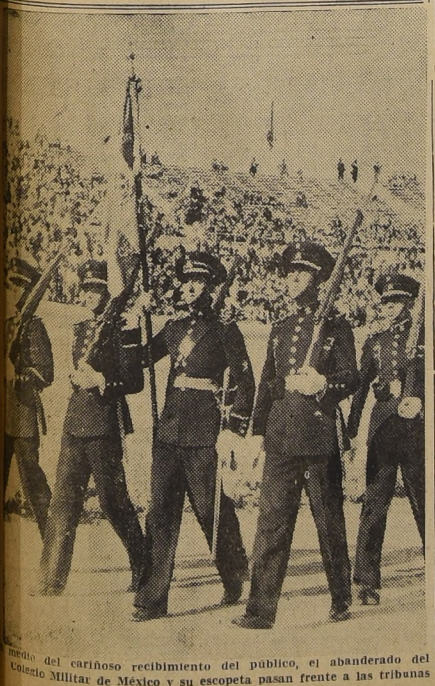
Resultado del cariñoso recibimiento del público, el abanderado del Regimiento Militar de México y su escolta pasan frente a las tribunas

12 horas.—Almuerzo ofrecido a la Delegación Comercial mexicana, en el local del Banco Central de Chile, señor Marcial M., en el local del Banco. 2 horas.—Inauguración de las Exposiciones de: 1. Bellas Artes mexicanas. 2. Arte popular mexicano. 3. Productos comerciales mexicanos, en el Palacio de Bellas Artes. 5.30 hrs.—Banquete ofrecido por el Comandante en Jefe del Ejército al Excmo. señor Embajador Extraordinario, coronel don Ignacio Beteta. — Casino de la Escuela Militar.