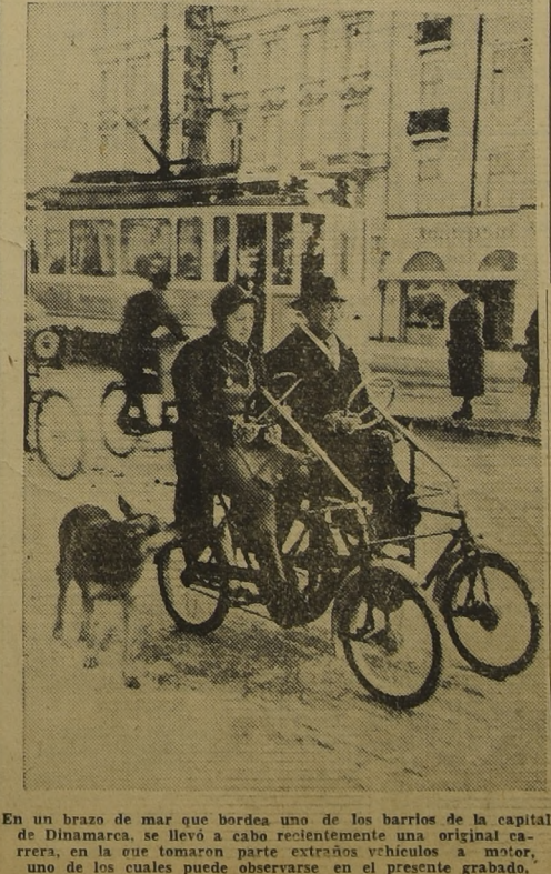
En un brazo de mar que bordea uno de los barrios de la capital de Dinamarca, se llevó a cabo recientemente una original carrera, en la que tomaron parte extraños vehículos a motor, uno de los cuales puede observarse en el presente grabado.

BRUSELAS, 1 (UP). — El presidente del Comité Internacional de los Juegos Olímpicos, M. Baillet-Latour, ha declarado a la United Press: "sólo unos diez países europeos contestaron afirmativamente a la petición del Comi