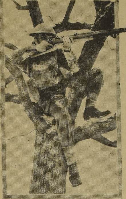
Curiosa posición adoptada por un centinela avanzado de una patrulla británica a fin de dominar una amplia extensión de terreno y desbaratar una posible sorpresa del enemigo

RES, 10.— (UP).— Mien- intimidacion del alo- scandinavas se momento a otro, en semi-oficiales se ha ne Gran Bretaña piensa as aguas o desembar- cualesquiera de los puer- dinavos, y han agregado quiera medida que se e debe permanecer en