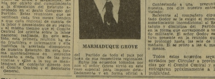
MARMADUQUE GROVE del Partido de todo el país por una de sus respectivas regionales. Entre los acuerdos tomados por el Comité Central y el Secretario General...