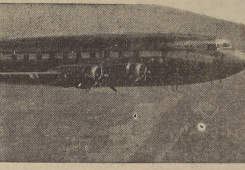
Tipo de avión Douglas DC-4 de 42 pasajeros—uno de los aviones más grandes del mundo—del cual la Panagra ha mandado a construir tres para acelerar su servicio entre Cristóbal, Santiago y Buenos Aires.

y a la vez acomodar el notable aumento de tráfico que se ha registrado últimamente entre Norte y Sud América. Este gigantesco avión, que pesa en total 25 toneladas y tiene una velocidad de crucero de 350 kilómetros por hora, cuenta además con un mecanismo especial de aire comprimido, mediante el cual la cabina se mantiene a una presión atmosférica normal sea cual sea la altura a que se eleve.