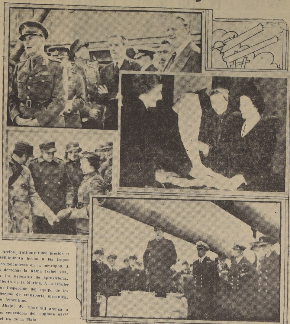
Arriba: Anthony Eden preside el recibimiento hecho a las tropas neozelandesas en la metrópoli. A la derecha: la Reina Isabel visita los depósitos de aprovisionamiento de la Marina. A la izquierda: inspección del equipo de los cuerpos de transporte mecanizado femenino. Abajo: W. Churchill atenga a los vencedores del combate naval del Ro de la Plata.

También se ha informado inconfirmadamente que Alemania ha cancelado sus pedidos de minerales por la vía de Narvik, a fin de que no sean apresados por los ingleses