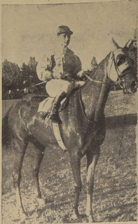
Anaconda, después de ganar el clásico "Samuel Larrain Bulnes". Jinetes: J. Molina

Cubiertos los primeros tramos de la recta, se hizo presente Galeben, que en las populares do-