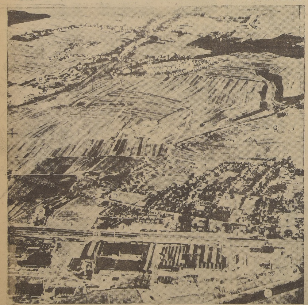
Es esta vista de la tan famosa línea de defensa fronteriza alemana (Línea Sigfried), una prueba objetiva de los vuelos de reconocimiento hechos a cabo por aviones de la Real Fuerza Aérea británica. Ella refleja un aspecto cercano al Sarre y muestra primeramente: A, población nueva; B, un muro de escoria; C, área de emplazamientos de concreto comunicados entre sí por túneles subterráneos; D, camino principal; E, ciudad de Boss; F, gasómetros; G, emplazamientos de concreto; H, línea principal del ferrocarril; I, estación de ferrocarriles; J, río Saar.