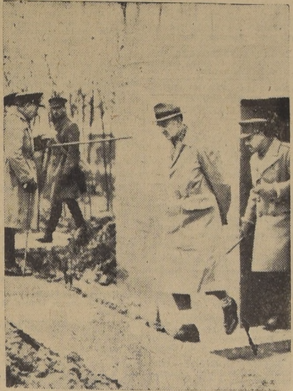
El Premier Chamberlain durante su última visita al frente occidental...