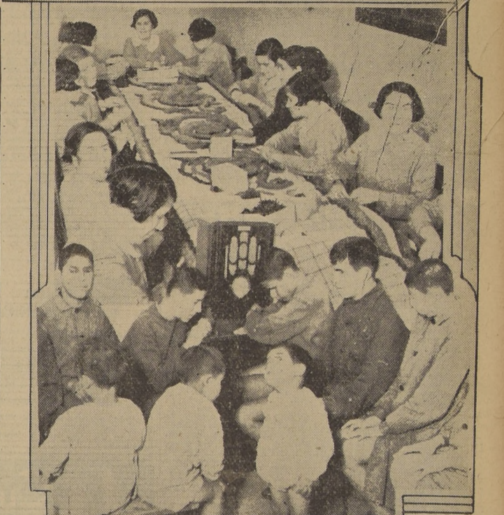
Escuchas lecciones por nuestro grático durante la visita que hicimos ayer al Hogar del Ciego de la Sociedad Santa Lucía, ubicada en la Gran Avenida

El Hogar del Ciego es un verdadero reduto de amor al prójimo y a la niñez desvalida. Por eso es que las damas de la Sociedad Santa Lucía, que tan abnegadamente cumplen su admirable misión, confían en que el comercio, la industria, la Banca, y el público en general, sean generosos para contribuir al sostenimiento de esta obra que demanda muchos miles de pesos, y que está destinada a socorrer centenares de niños que no cuentan con otro medio de protección.