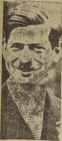
S. M. el Rey Carol II, de Rumania, país que celebra hoy su fiesta nacional.