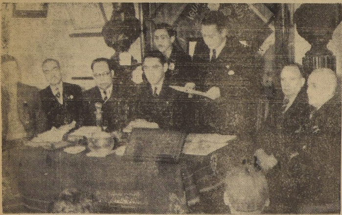
Mesa directiva de la "Sociedad Mutual Igualdad y Trabajo", presidiendo la junta general solemne con que la institución celebró su 46.º aniversario. A este acto siguió el banquete anual de la prestigiosa colectividad.

En el Politeama ofrecerá velada el Depto. Cultural