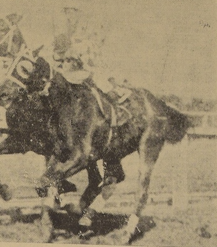
En reñido final, Fayal (por fuera) domina por cabeza a Leoncavallo, cuyo jinete tiene que levantar a su cabalgadura.

Al salvar el primer obstáculo de la tierra derecha, Fayal y Leoncavallo dominaron a Donaire, llevando siempre clara ventaja el hijo de Tagore, pero en los últimos metros decayó en su acción, y Leoncavallo estuvo a punto de batirlo, sucumbiendo a una cabeza, Tercera, a 10 cuerpos, remató Antequera; cuarto General Grant; quinto Tapada; sexto, Linares y séptimo, Ovi-