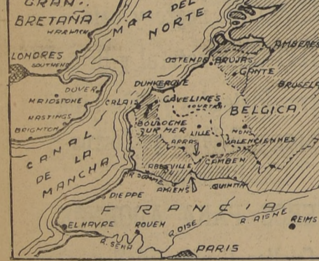
Map showing military positions and movements in the Channel region, including Calais, Arras, and Brussels. It details the positions of German and Allied forces, and the locations of key battles and strategic points.