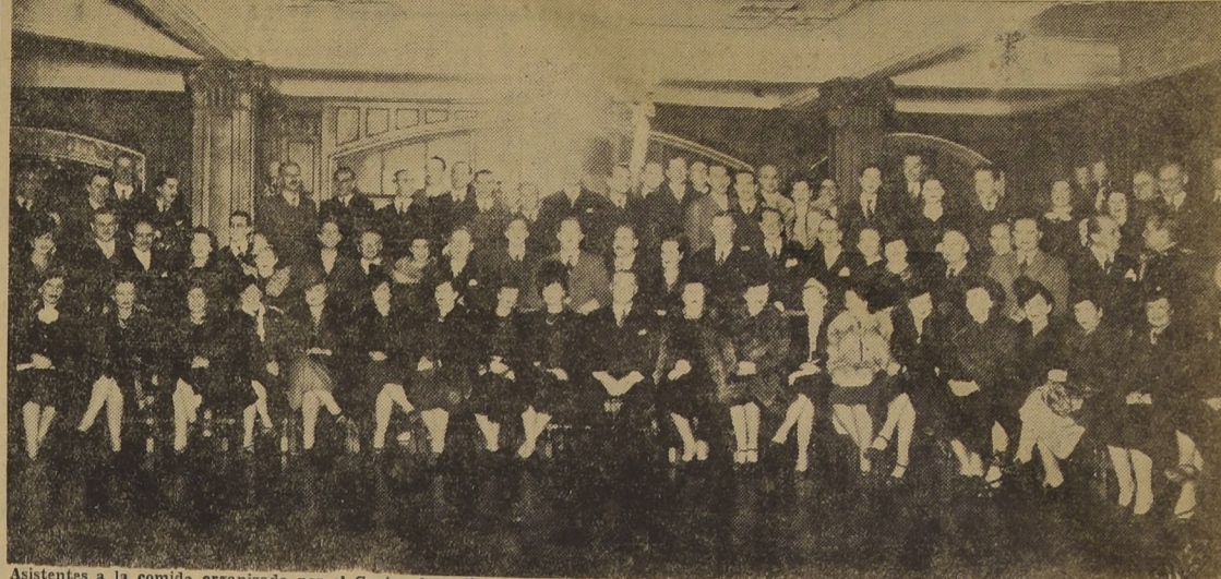
Asistentes a la comida organizada por el Centro Argentino de Santiago en celebración del aniversario patrio del vecino país. La fiesta se efectuó en los comedores del Gath y Chaves.