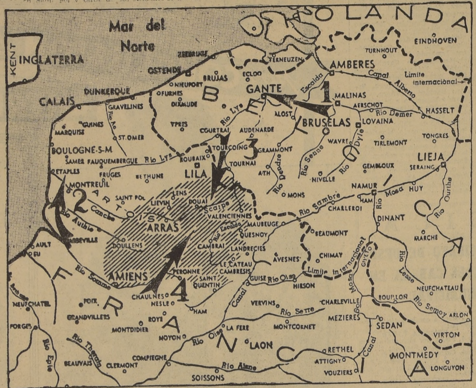
Map showing military positions and movements in the Channel region, including Calais, Arras, and Brussels. It details the positions of German and Allied forces, and the locations of key battles and strategic points.

COMUNICACIONES FRANCESES. PARIS, 26. (U. P.)—El comunicado de guerra No 581 emitido esta mañana decía: "El enemigo lanzó varios ataques contra nuestro frente del norte, los que fracasaron. Los ataques locales que lanzamos en el frente del Somme resultaron ventajosos para nosotros y ocupamos varios puntos nuevos en el Somme. Entre el Aisne y el Mosa, ambas artillerías estuvieron activas y un poderoso ataque del enemigo fué rechazado en la región de Montmédy".