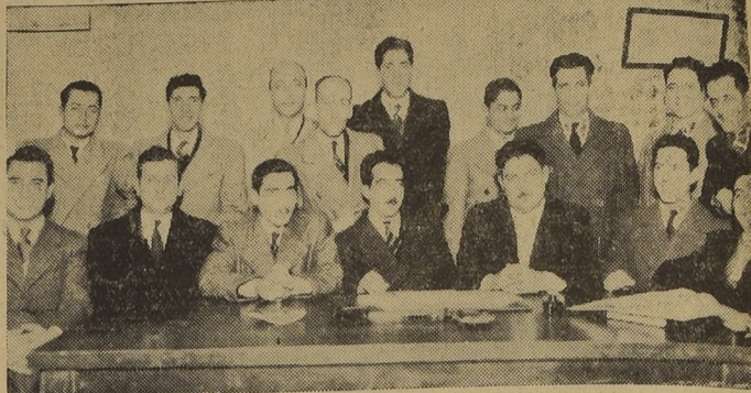
Una concurrencia junta general de socios celebró últimamente el Sindicato Profesional de Empleados de la Cia. de Teléfonos...