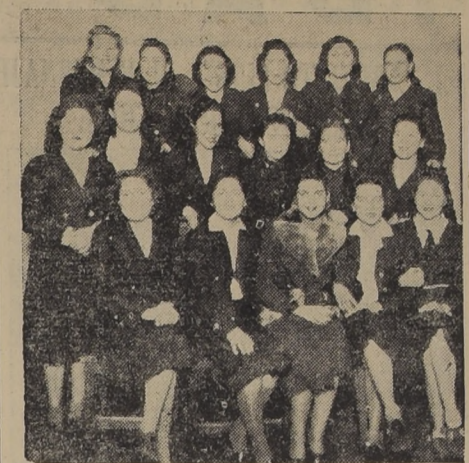
Grupo de alumnas del 1.º Año B, 2.º Grado, del Instituto Comercial Femenino, establecimiento que celebró con diversos actos el viernes último, el aniversario de su fundación.