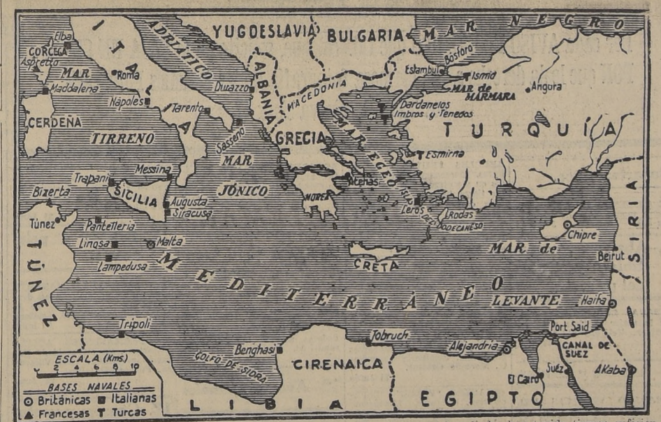
WASHINGTON, 10. — (U. P.) Los peritos militares, en sus conversaciones privadas, han supuesto que los primeros objetivos que se propondrá Italia en el Mediterráneo serán apoderarse del control de los puntos que están en manos de los británicos.

Se piensa que los aliados han tenido tiempo suficiente de advertencia para prepararse para un golpe de mayores proporciones en Europa misma.