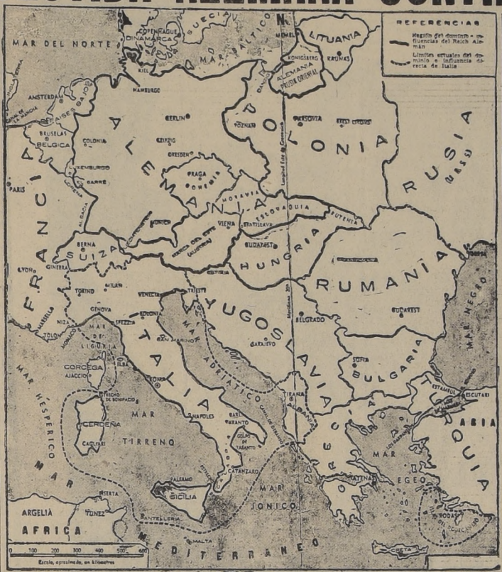
Posición geográfica de las potencias totalitarias que se hallan en guerra con las dos grandes democracias del Occidente europeo

Este avance fué contenido en todos los puntos por nuestros violentos contraataques. ESCUADRA INGLESA CASO-NEA A LOS ALEMANES