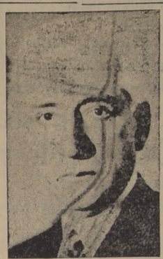
Ministro de Educación, don Juan Antonio Iribarren