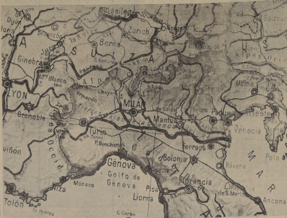
Italia, que anteayer, bombardeó la base naval inglesa de Malla, se ha abstenido hasta el momento de toda acción militar contra las fuerzas de aterrizaje del ejército italiano. El presente mapa corresponde a la región en que se han de librar las primeras acciones de guerra entre las antiguas aliadas.