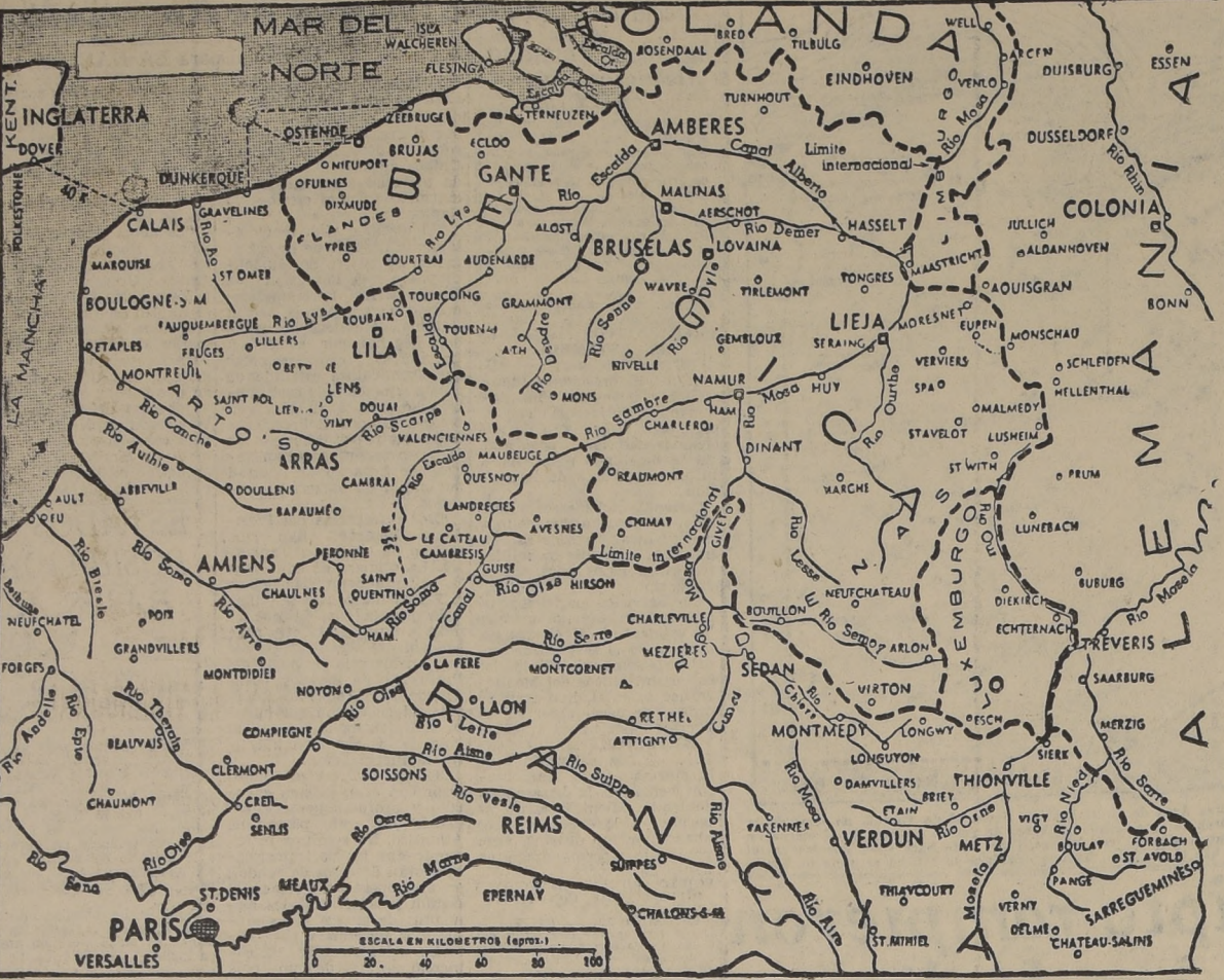
A pesar de los incansables contraataques franceses, que han causado enormes pérdidas de hombres y material al ejército invasor, los alemanes han conseguido su lento movimiento envolvente destinado a cercar la capital de Francia. En el día de ayer lograron cruzar el río Marne cerca de Chateau Thierry, avanzando que refuerza y hace cambiar el aspecto de la actual ofensiva contra París