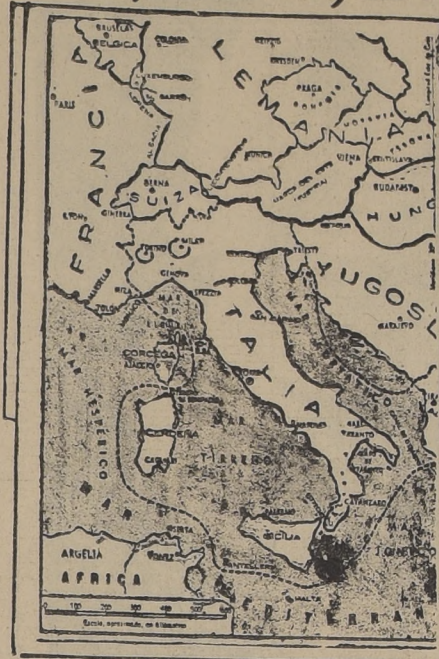
Las fuerzas aéreas del Imperio Británico desarrollaron ayer una extraordinaria actividad, llevando a cabo con todo éxito numerosos bombardeos e incursiones aéreas sobre el norte de Italia y sobre las bases aéreas de las colonias italianas de Libia, Eritrea y Etiopía. En el norte de Italia atacaron la ciudad de Turín, una de las más industriales de la península, y el puerto de Génova, el primero de la metrópoli.

LONDRES, 12. — (U. P.). El correspondiente de la Exchange Telegraph Co. en Nairobi (capital de la colonia africana de Kenia) comunicó que en el cuartel de las fuerzas del África Oriental Británica se anunció que aviones de bombardeo