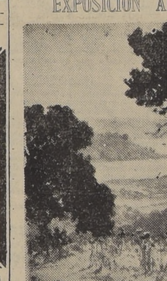
Contra luz de tarde. Fondo El Convento. (Oleo de Alfredo Araya)

Esta tarde a las 18 horas se efectuará en la Sala del Banco de Chile la inauguración de la Exposición de cuadros al óleo del conocido pintor don Alfredo Araya.