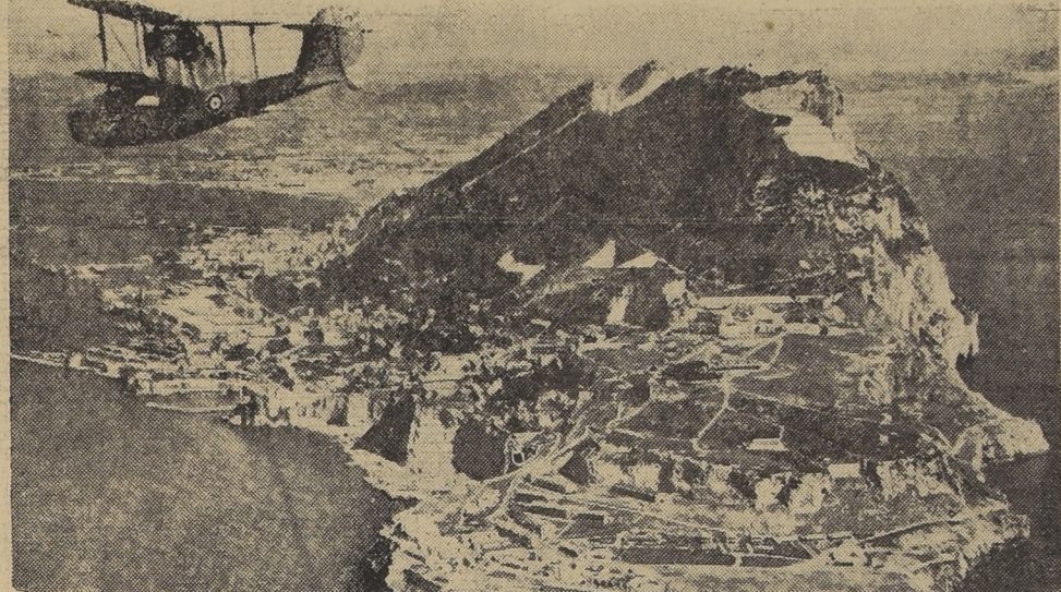
Vista aérea del Peñón de Gibraltar

GIBRALTAR, 5.—(UP).—Aeroplanos enemigos efectuaron incursiones sobre Gibraltar en las