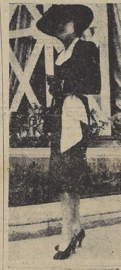
Sencillo traje de lana negra que se abre sobre un chaleco blanco. El cinturón es blanco y del mismo material que el chaleco.