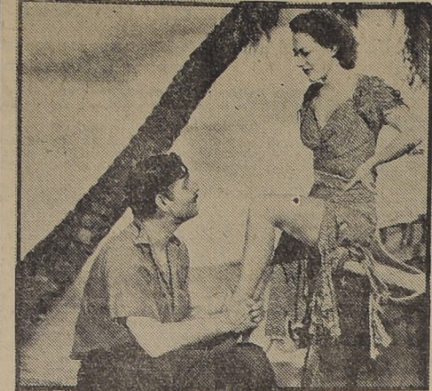
Clark Gable y Joan Crawford, en una escena de "Extraño Carga mental", la brillante producción que hoy da a conocer la pantalla del Metro.