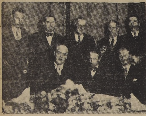
Un grupo de sus relaciones ofreció en los salones del Tong-Fang...