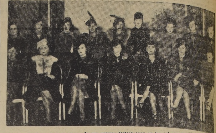
Asistentes al té con que un grupo de sus amigas festejó ayer en los salones del Crillon...