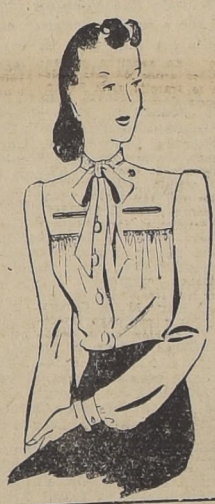
Se verá muy bien en satén. De cada lado del delantero, se frunce sobre un canesú, sobre el que van corridos dos bolsillos...