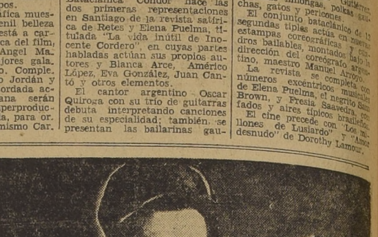
Dorothy Lamour and Tyrone Power

Los Borcosque, y que será el próximo estreno del Teatro Continental. El tema gira alrededor del buque escuela de la Armada argentina, la vida en la Escuela Naval, los sentimientos de camaradería que se exhiben, permaneciendo muchos meses en las carteleras.