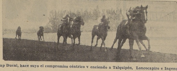
Cap Ducal, hace suyo el compromiso céntrico y enciendo a Talquipén, Loncopapiro e Ingenuo