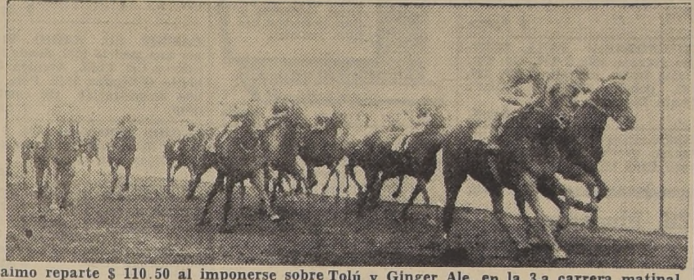
Nocaimo reparte $ 110.50 al imponerse sobre Toli y Ginger Ale, en la 3.a carrera matinal

Numero concurrencia hubo en las carreras de La Palma, en la mayoría de las cuales tuvieron resultados sorprendentes para los apostadores y dieron origen a emociones en la multitud. Pasamos en seguida a hacer la relación de las diversas pruebas de la mañana.