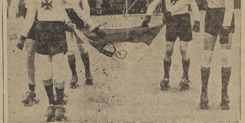
Green Cross, entra a la cancha llevando extendida una bandera del Perú. Fue un acto simpático.