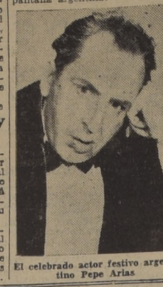
El celebrado actor festivo argentino Pepe Arias