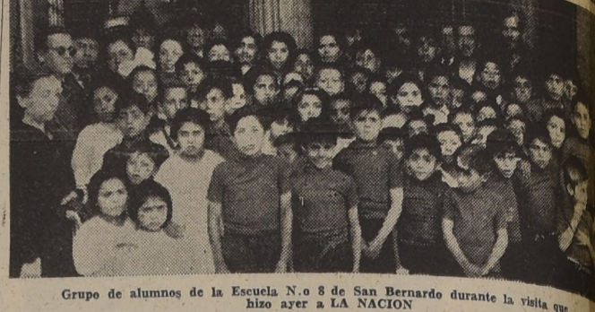
Grupo de alumnos de la Escuela N.º 8 de San Bernardo durante la visita que hizo ayer a LA NACION.

En la tarde de ayer, recibimos la agradable visita de un numeroso grupo de alumnos de la Escuela N.º 8 de San Bernardo, que acompañados de sus profesores visitaron a Santiago, a fin de conocer algunos sitios públicos, como el Estadio Nacional, el Zoológico, etc.