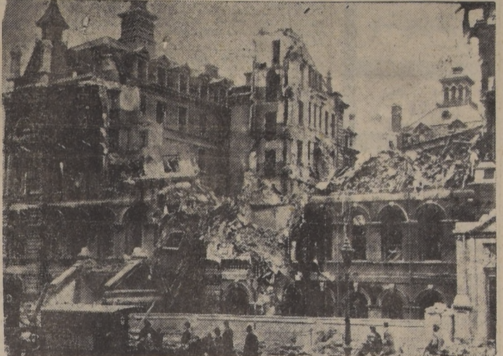
El antiguo hospital de Santo Tomás en Londres, destruido por los aviones de bombardeo del Reich

ANDANADAS DE BOMBAS DE ALTO PODER EXPLOSIVO FUERON LANZADAS SOBRE LOS MISMOS OBJETIVOS ALCANZADOS EN LA NOCHE ANTERIOR