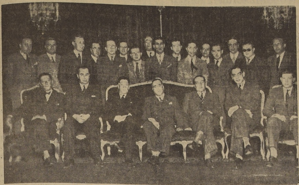
Asistentes al té ofrecido por el Canciller en honor de los periodistas.

El Ministro de Relaciones Exteriores, don Manuel Bianchi Gundian, ofreció ayer unas once en el Salón Rojo de la Cancillería a los directores de los diarios de la capital, jefes de las agencias noticiosas y cronistas encargados de las informaciones de las reparticiones que funcionan en el Palacio de la Moneda.