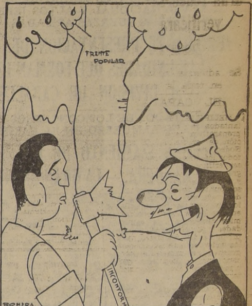
VERDEJO. — Es inútil, el árbol es muy sólido y tiene raíces muy profundas.