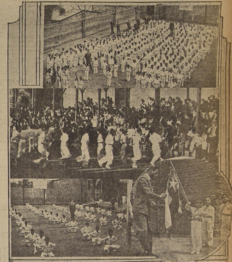
Durante la presentación anual de Gimnasia de los alumnos de la Escuela Superior de Hombres N.º 43.

En la tarde de ayer, se verificó la presentación anual de gimnasia de los alumnos de la Escuela Superior de Hombres N.º 43, fiesta que fué amenizada por el Orfeón de Carabineros.