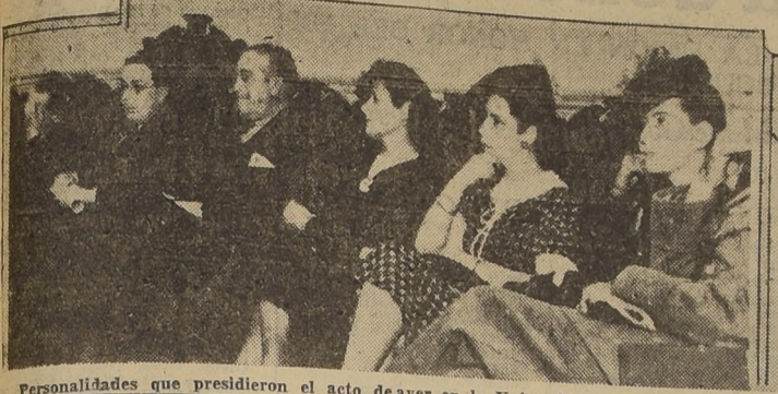
Personalidades que presidieron el acto de ayer en la Universidad de Chile

Se efectuó ayer con especial brillo en el Salón de Honor de la Universidad de Chile