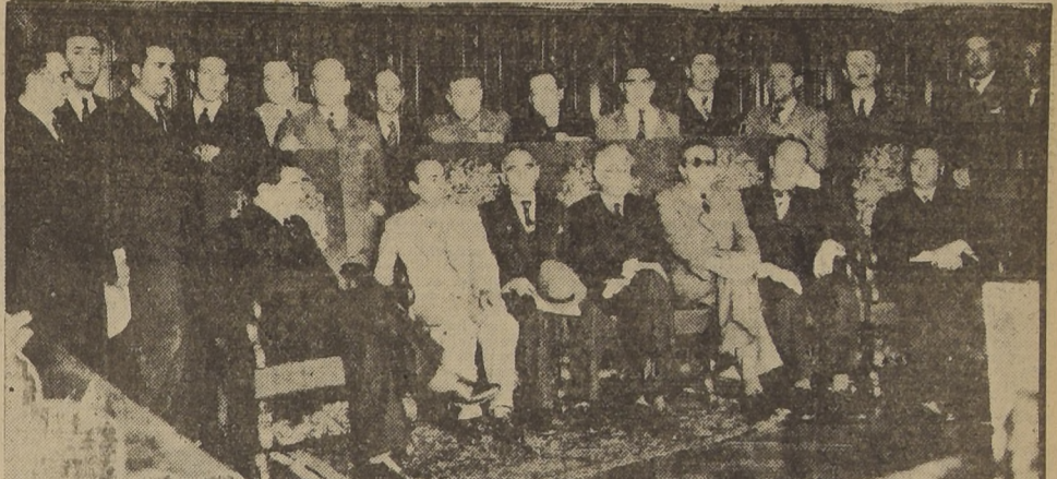
El Ministro del Interior señor Guillermo Labarca, con delegación de parlamentarios frentistas que lo visitó ayer

Expresaron su más amplia adhesión al Gobierno frente a las injustificadas censuras de los elementos de la oposición.— Declaró el Primer Mandatario que continuará su gobierno conforme a las normas señaladas por la Constitución y terminará su periodo presidencial respetándola y haciéndola respetar