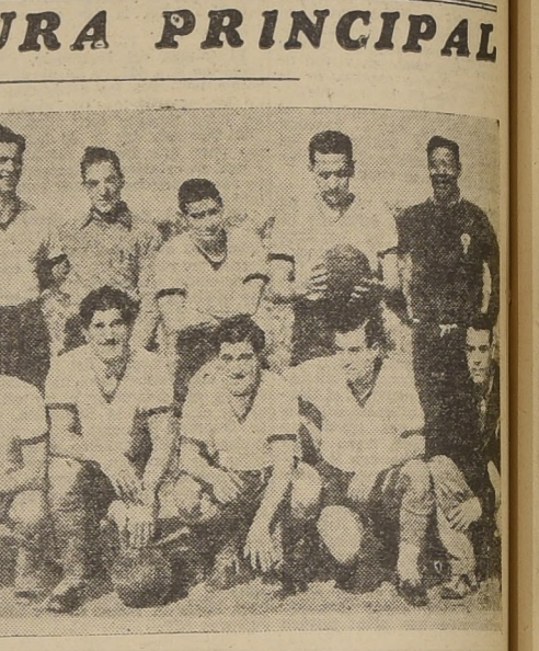
Huracán, el poderoso conjunto argentino que debutó el domingo frente a Colo-Colo. Esta foto corresponde a uno de sus últimos partidos hechos en Buenos Aires.