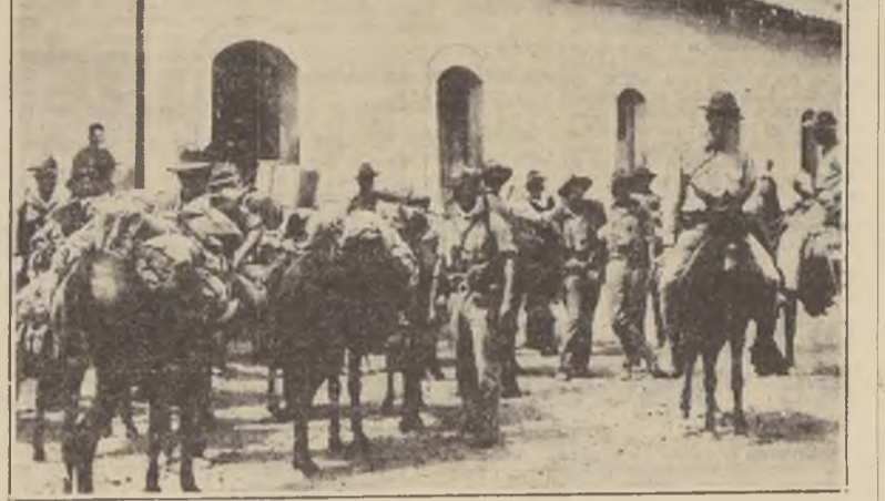
Un contingente de marinos norteamericanos, preparándose para salir en busca de los insurrectos nicaraguenses, que recientemente dieron nuevas señales de actividad en la zona del norte. Sofocada aquella actividad, los marinos serán ahora retirados gradualmente de Nicaragua.