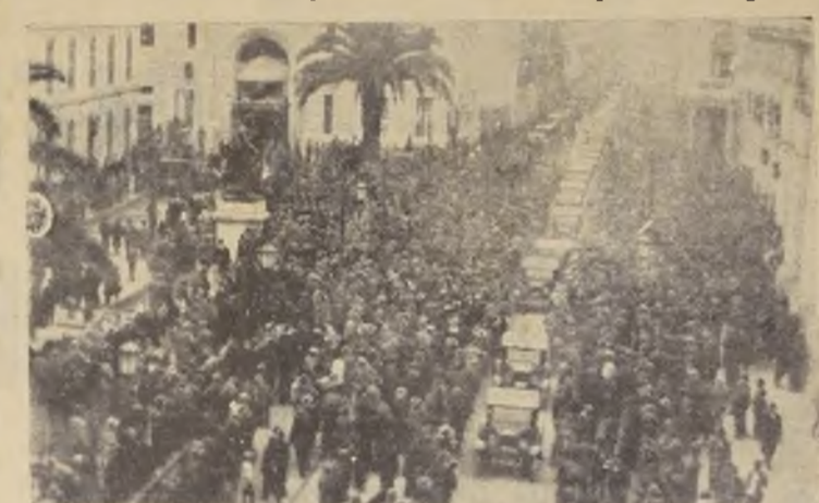
Durante el desfile de los vehículos motorizados.

Integraban la comisión los directores de las siguientes instituciones: Sindicato de Dueños de Autobuses, Sindicato de Choferes y Cobradores de Autobuses, Sindicato