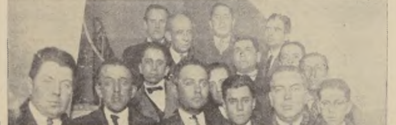
Grupo de delegados a la Convención pro Colonización Nacional que se inaugura hoy, en la visita que hicieron ayer a "La Nación"