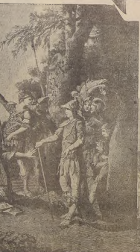
Reproducción de una célebre pintura que muestra a Diógenes, teniendo ante sí al joven Emperador Alejandro el Grande, a quien dijo: "No me quites el sol".

En la actualidad, gran parte de este distrito tiene construcciones modernas y se necesitarán varios años para removerlas. La superficie de la tierra no es suelo que hemos pisado