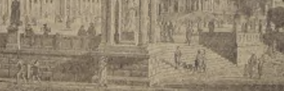
He aquí la obra de un arquitecto, quien ha imaginado lo que sería el Agora, y tal como se cree que será una vez que se le restaure, después de las excavaciones que se están haciendo en el sitio en que estuvo hace miles de años.

Todo esto está enterrado y habrá que hacer una excavación profunda