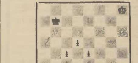
Juegan las blancas y ganan