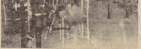
APARATO DE CIRCUNDUCCION DE LA CADERA, DE MOVIMIENTO PASIVO, CON ELECTRICIDAD, Y APARATO DE VIBRACION GENERAL.

Llama especialmente la atención el pabellón de Kinesioterapia, que es lo más completo que hay en el país, destinado a la reeducación física de los accidentados, que constituye una de las funciones más importantes que desarrolla la institución que visitamos y que caracteriza su aspecto social, que