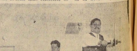
SALA DE MECANOTERAPIA. SECCION PRINCIPAL

La competencia en un servicio social es inaceptable, porque lo encarece y lo perjudica.