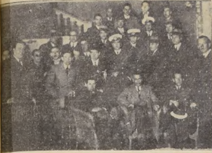
Oficiales de Aviación y periodistas asistentes a la exhibición de la superproducción "Titanes del Aire", con Clark Gable y Wallace Beery, que la Metro Goldwyn Mayer ofreció ayer, privadamente, en el Teatro Imperio, a la Fuerza Aérea Nacional.

Señores Agricultores, Viñateros, Chacareros, Arboricultores Adquieran sus semillas, abonos, desinfectantes, etc., a precios únicos y con maximum de facilidades.