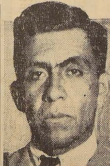
Excmo. señor don Luis Miguel Sánchez Cerro, Presidente de la República del Perú

En el mundo el Perú ocupa el primer lugar en la producción de vanadio, el tercero en el platino, el séptimo en el algodon, el octavo en la cobre, el noveno en la de petróleo y el décimo en la producción de azúcar mundial; sus ferrocarriles cuentan con cerca de cinco mil kilómetros de vías, doscientas mil hectáreas de terrenos irrigados y cincuenta mil kilómetros de carreteras.