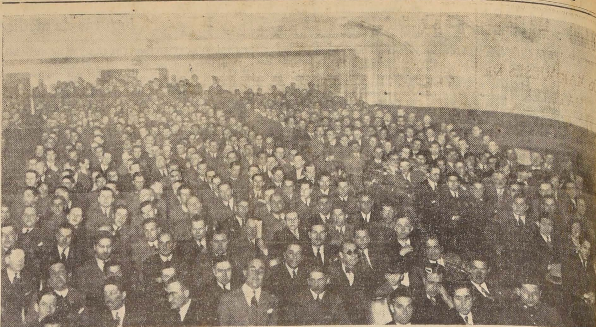
OFICIALES, PERSONAL DE LA SUBSECRETARIA, TROPA Y PERSONAL DE LA MAESTRANZA DE LA ESCUELA DE AVIACION QUE ASISTIERON AYER A LA EXHIBICION PRIVADA DE LA PELICULA "TITANES DEL AIRE", OFRECIDA POR LA METRO GOLDWYN MAYER DE CHILE, EN EL TEATRO IMPERIO

CULTO PARA EL 28.— Jubileo circulan: San Juan Evangelista (Lira 428), los días 28 y 29.