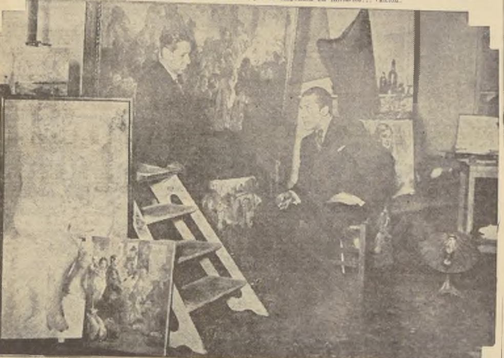
Un rincón del taller