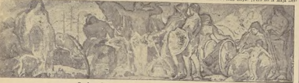
Gordon.—Boceto para el friso central del Museo Histórico

que sean, me cortan la saliva en... momento en que le doy a Gordon... de su arte... ¿Y en Francia?