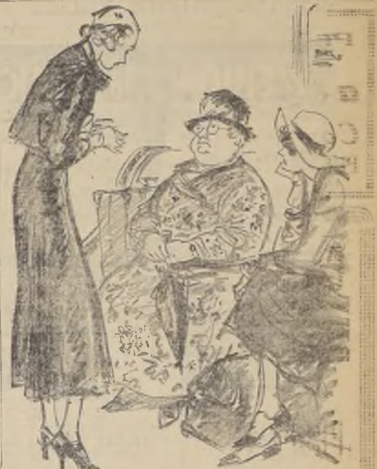
Hemos decidido, sea, que usted elija con cuál de nosotros quiere vivir, porque no podemos ponernos de acuerdo.

Los pedidos de provincias se atienden únicamente al recibir el importe, más $ 1.— para franqueto.