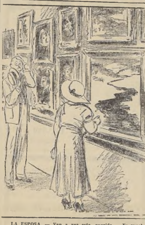
LA ESPOSA. — Ven a ver esto, querido... Es mucho más fresco que los otros.