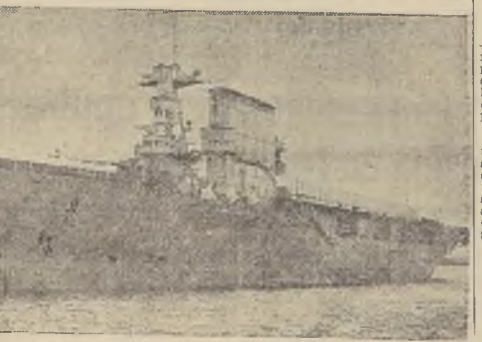
El porta-aviones norteamericano "Saratoga".