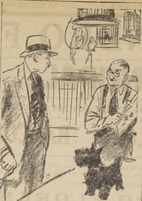
—Vea, el pedigrés es lo menos que me importa. ¿Sabe traer un bastón cuando a uno se le cae?