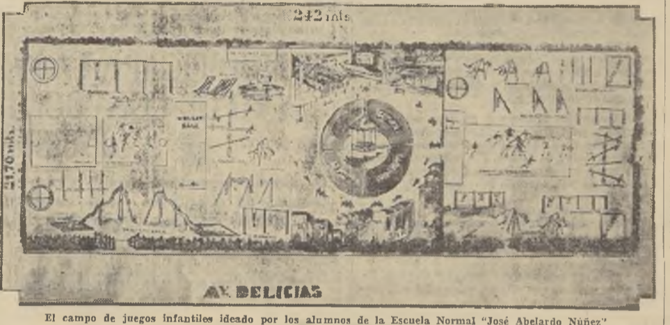
El campo de juegos infantiles ideado por los alumnos de la Escuela Normal "José Abelardo Nuñez"

destinó algunas sumas de dinero. En la tarde de ayer conversamos con un grupo de alumnos de la Normal, quienes nos manifestaron lo siguiente: