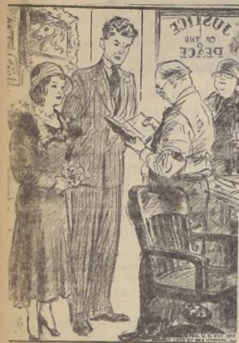
EL NOVIO (Al encargado del Registro Civil, que lee el acta matrimonial a todo galope). — Oiga, señor: Haga el favor de ir más despacio. Queremos tener un recuerdo de este día, para el futuro.

Para pasar los días de Fiestas Patrias, este año la mayor atracción son las Pastelerías de Ramis Clar. "LA ISLEÑA", "NEGRO BUENO", "OLIMPIA"