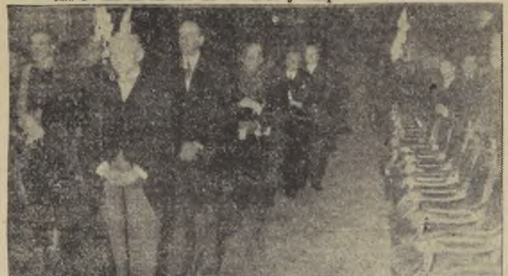
Miembros del Cuerpo Diplomático asisten al Te-Deum