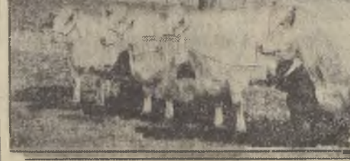
Espléndidos ejemplares de reproductores Shorthorn. Esta raza de vacunas es la preferida para la producción de carne...