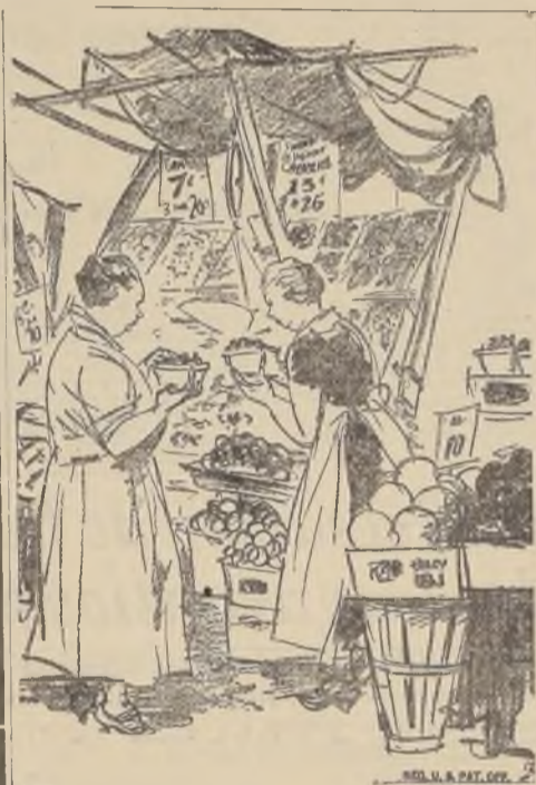
—Si lleva dos, le rebajo diez centavos. —Bueño; llevaré dos, pero no es por los diez.