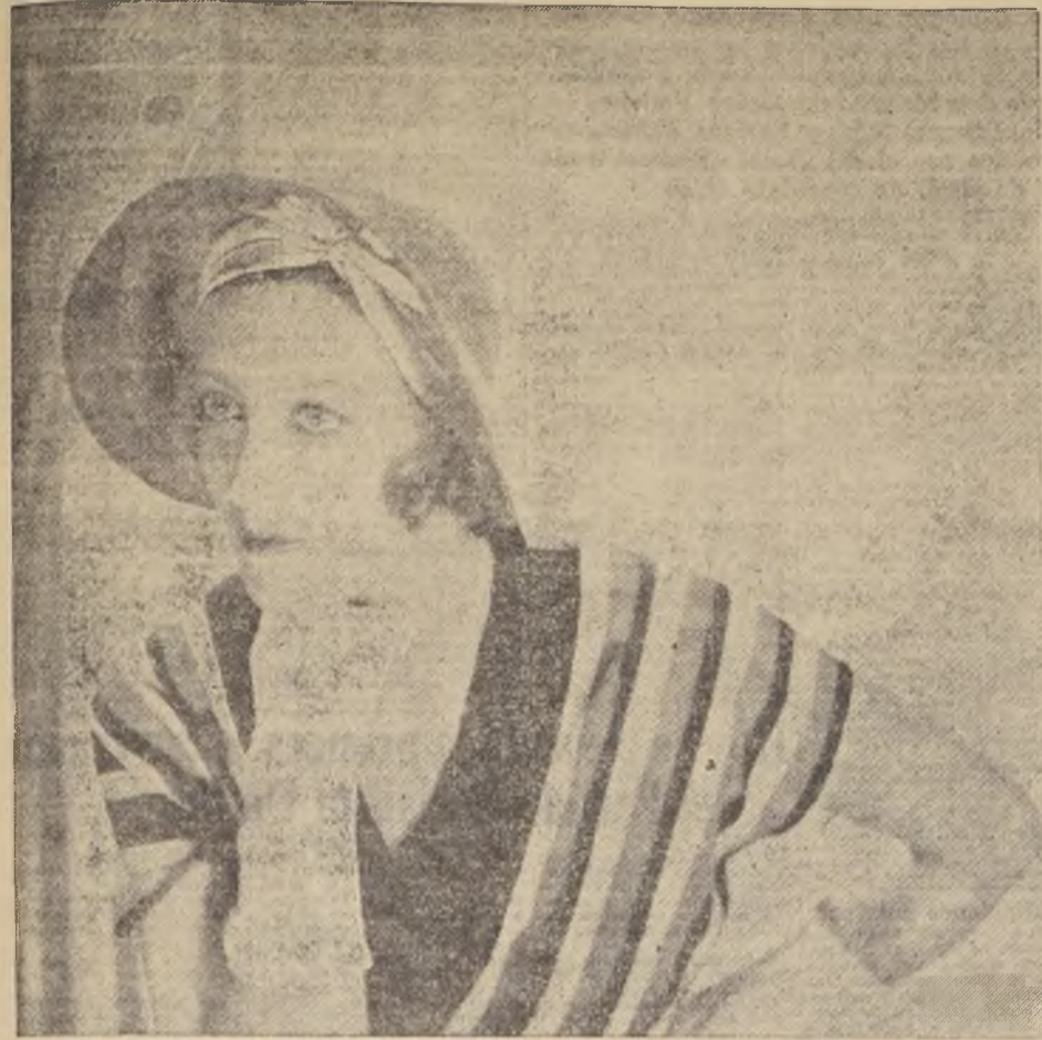
He aquí una linda fotografía de Joan Crawford, la conocida actriz del cinematógrafo. Ella es una de las que poseen más lindo cuerpo, por eso muchos directores la usan en sus películas en papeles de maniquí. Tiene esta mujer una gracia muy grande en su andar, sabe lucir lo que se pone, no siendo una gran actriz como Greta Garbo, o la Marie Dressler; tiene un gran atractivo como mujer, de aquí su éxito en la pantalla; tiene el tipo clásico de la americana de New York. Es ella la intérprete de casi todas las películas que más gustan hoy día, como "Virgenes Incompletas", y "Poseída". En esta última trabaja con Clark Gable, que es también un hombre de mucho gancho. Es esta la definición que yo le daría al encanto de la Joan Crawford: tiene gancho, además de ser bonita