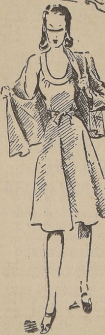
Arriba: Vestido en brin de hilo blanco, con botones de color y cinturón tejido al "crotchet" en el tono de los botones. En segundo lugar: Vestido de playa en hilo azul claro, con el cinturón y el redondeo que forma escote en azul más oscuro. Chaqueta suelta para cubrir la espalda. Abajo: "Short" en formas de paraguas y corpiño corto para tomar sol. Por último: Vestido corto de playa en algodón liso color canario y saco de hilo rayado en marrón y verde.