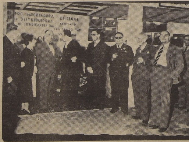
En la Exposición de Minería de San Felipe, un grupo de personas visita el STAND DE LOS PRODUCTOS SUNOCO

presentados en la Exposición de Minería de San Felipe.