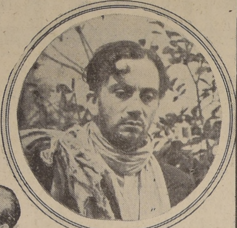
LA EXPRESION COSTUMBRISTA MAS COLORIDA!

Es una cinta de ambiente intensamente dramático, la cinematografía argentina nos revela el inmenso drama de las vidas condenadas a vivir en un ambiente estrecho y mezquino, en el que imperan el chisme, la intriga pequeña y la maledvolencia, que despiertan el arrastrarse lugareño de la existencia, lejos de las grandes ciudades.