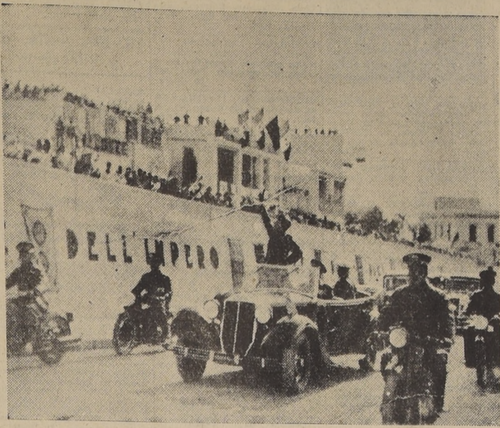
Vista de Tobruk el día en que Mussolini desfiló por sus calles con motivo de la inauguración del camino imperial que corre a lo largo de la costa de Libia, 1.822 kilómetros.—Esta carretera, construida para la invasión de Egipto, está siendo utilizada ahora por las fuerzas del general Wavell en su avance sobre Libia

precia más y más el barbaro de la ar- tillería y aviación VANCE INGLES ACIA BENGASI