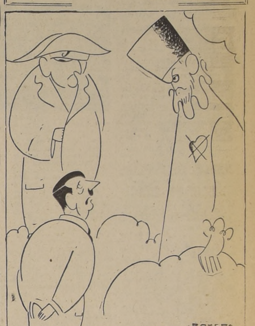
FELIPE II.—Acuérdate de la Invencible, Adolfo... NAPOLEON.—Y de Waterloo.