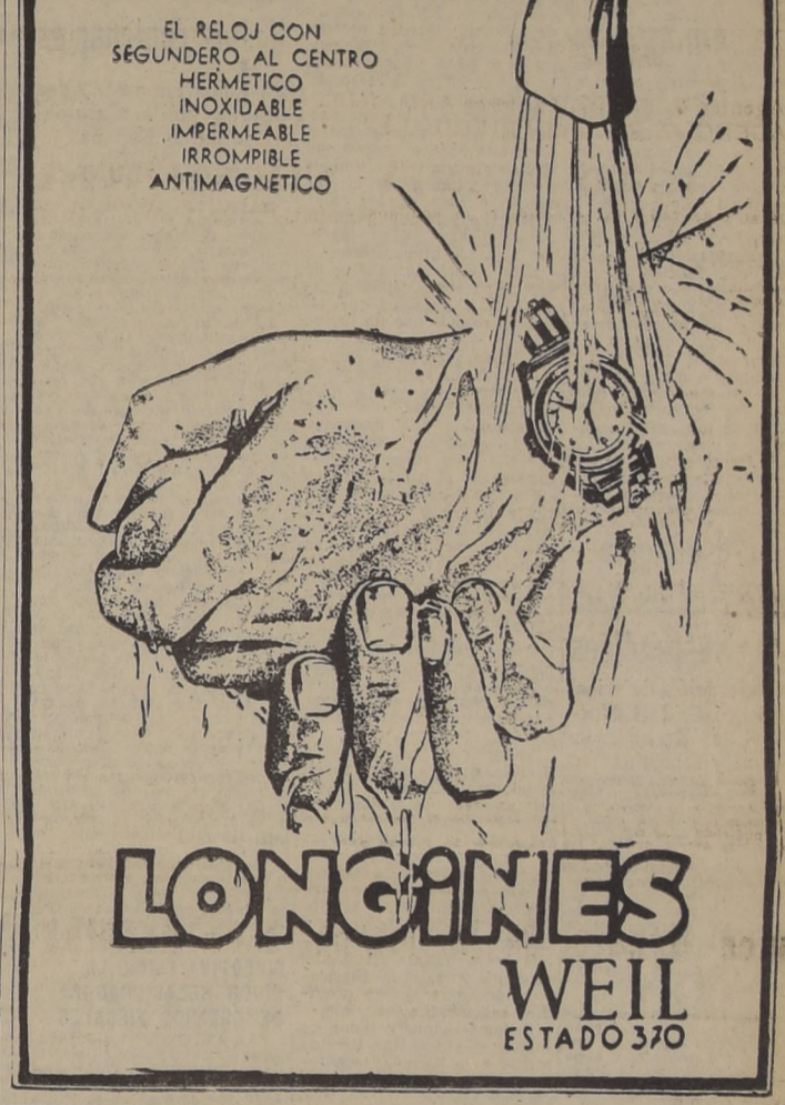
EL RELOJ CON SEGUNDE RO AL CENTRO HERMETICO INOXIDABLE IMPERMEABLE IRROMPIBLE ANTIMAGNETICO

carbazada entre las fortificaciones de la fortaleza de Tobruk. Solamente en la tarde lograron los australianos penetrar hasta las partes habitadas de Tobruk se halla en llamas y el vicio buque de guerra "San Giorgio" fué volado con dinamita. En el sector occidental de la fortaleza algunos fuertes siguen presentando todavía una tenaz resistencia a los ataques del enemigo. Las fuerzas italianas concentradas en Tobruk se componían solamente de una división y de varios destacamentos de marineros y guardias de frontera. El enemigo se ha visto perdido sufriendo por sus cinco divisiones atacantes son especialmente serias.