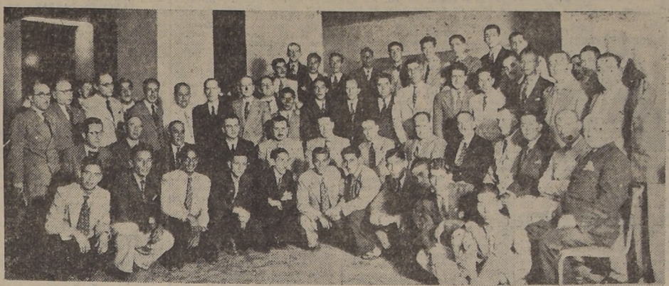
Asistentes al cocktail ofrecido por la Federación de Football de Chile en el "Esplanade", en honor de la delegación ecuatoriana...