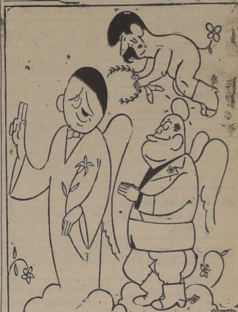
El Gran Dictador (versión cinematográfica de la D. N. B.)