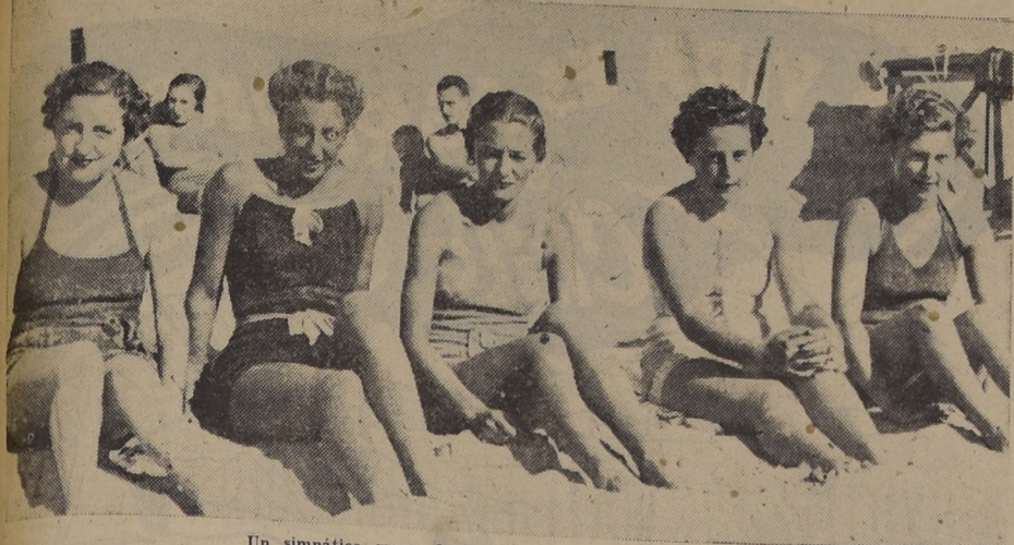
Un simpático grupo de bañistas en la playa de las Salinas