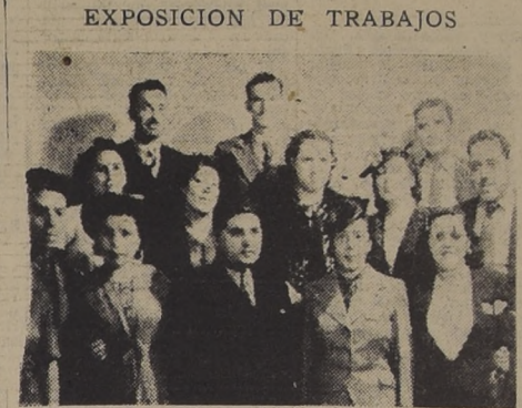
Profesores de las Escuelas Rurales, que ayer visitaron LA NACION