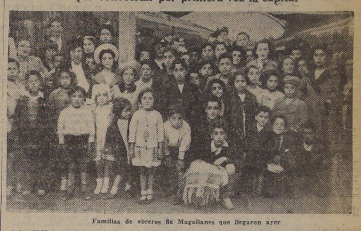
Familias de obreros de Magallanes que llegaron ayer

Este grupo de familias está compuesto por obreros y escolares, que conocerán por primera vez la capital