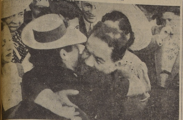
El Sr. E. a su llegada al Estadio Nacional, saluda a una de las alumnas distinguidas de la Escuela de Verano

S. E. el Presidente de la República asistió ayer al cocktail ofrecido por el Ministro de Educación en honor de los profesores y alumnos de la Escuela