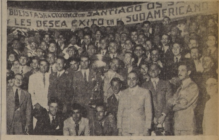
Los futbolistas argentinos a su llegada a Santiago

"Los peruanos deben hacer un lucido papel", nos dijeron los jefes de la delegación de Argentina. — Pedirán como refuerzos a Masantonio, Pedernera y Colombo. — Sus impresiones