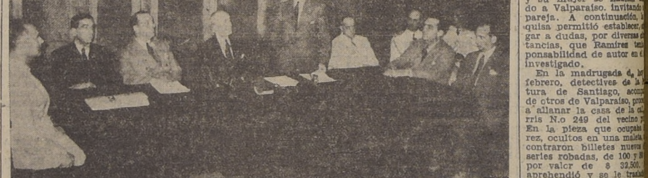
En la presente fotografía vemos un aspecto de la sesión de clausura de la Convención de Ingenieros celebrada en Lima...