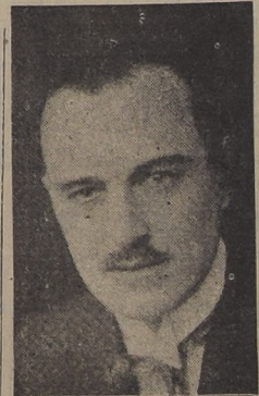
Sir George Lloyd

PARTO A NUEVA YORK LISBOA, 6.—(U. P.)—Mr. Wendell Willkie partió a bordo de un avión Clipper con destino a Nueva York a las 10 A. M. de hoy, vía Bolonia, Ginebra, Portuñuela, en el África Occidental.