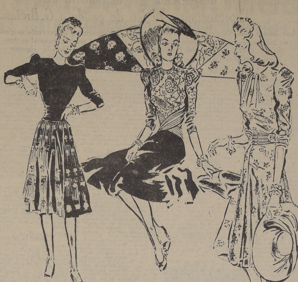
1.—Elegante y original este vestido con la blusa de crepe opaco en negro y falda plisada imprimé en fondo negro. 2.—Combinación contraria a la anterior con falda campana en crepe opaco negro y blusa imprimé drapada en la cintura. 3.—Imprimé en tonos claros con cintura de lo mismo, adornada de cintas grosgrain en los tonos del floreado.