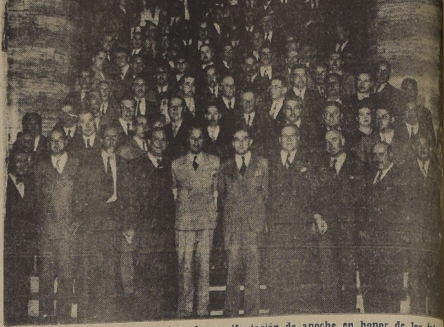
Parte de la numerosa concurrencia a la manifestación de anoche en honor de los líderes del Partido Radical

Asistieron más de quinientas personas. — Los oradores Larga ovación se tributó al Excmo. Sr. Aguirre Cerda