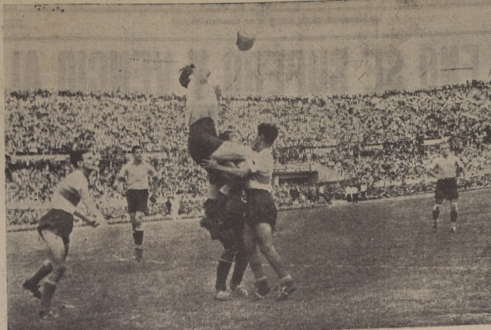
La tranquilidad guardavallas uruguayo, intercepta un centro de Freire. La ofensiva de los ecuatorianos resultó absolutamente ineficaz. Los celestes jugaron a voluntad.