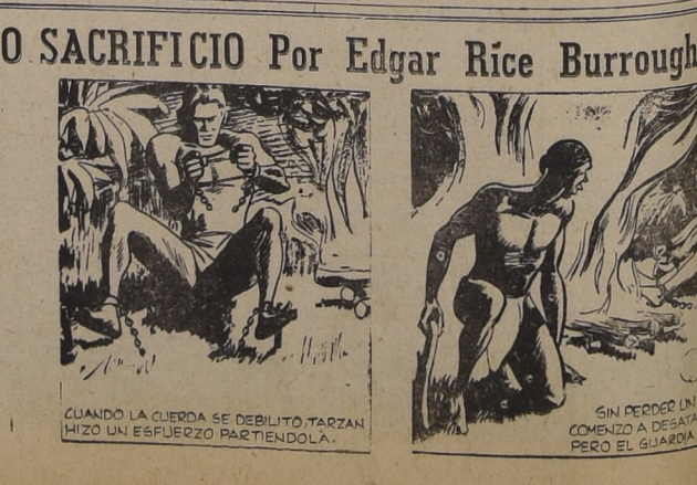
CUANDO LA CUERDA SE DEBILITO, TARZAN HIZO UN ESFUERZO PARTIENDOLA. SIN PERDER UN MOMENTO COMENZO A DESATARLA, PERO EL GUARDIA...