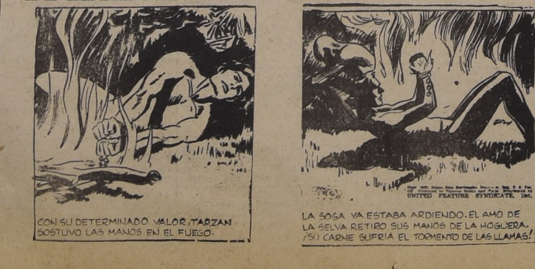
CON SU DETERMINADO VALOR, TARZAN SOSTUVO LAS MANOS EN EL FUEGO. LA SÓGA YA ESTABA ARDIENDO. EL AÑO DE LA SELVA RETIRO SUS MANOS DE LA HOGUERA. ¡SU CARNE SUPRÍA EL TORMENTO DE LAS LLAMAS!