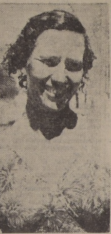
Maria Lenk, recordwoman mundial 100 metros estilo libre

LOS REPRESENTANTES BRASILEÑOS SE ADJUDICARON AYER LA POSTA DE 4 POR 100 ESTILO LIBRE PARA HOMBRES, SIGUIENDOLES LOS ECUATORIANOS GRACIAS A FORMIDABLE RUSH DE ALCIVAR. — SUSSY MITCHELL RETUVO, DESPUES DE IMPECABLE ACTUACION, SU TITULO DE CAMPEONA SUDAMERICANA EN SALTOS ORNAMENTALES. — EL PROGRAMA QUE SE DESARROLLARA EN EL DIA DE HOY