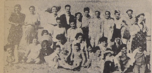
Personal de los servicios de Beneficencia que forman la colonia de Lloleo

La Dirección General de Beneficencia, interesada en desarrollar las actividades que promuevan al bienestar de su personal, ha organizado en este año una colonia de veraneo para el personal de los establecimientos hospitalarios de Santiago y sus familias.