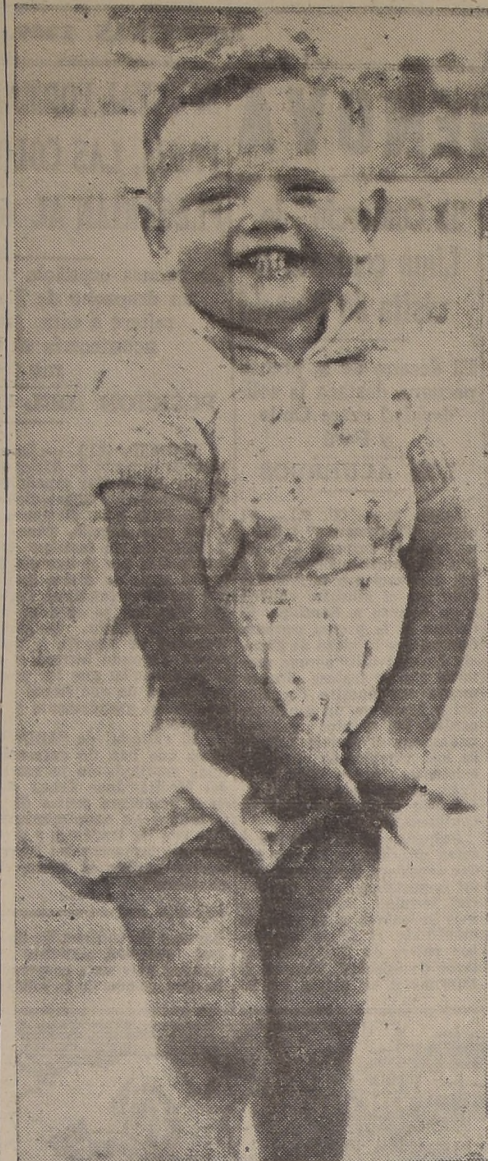
Un precioso veraneante en Las Playas de Cartagena