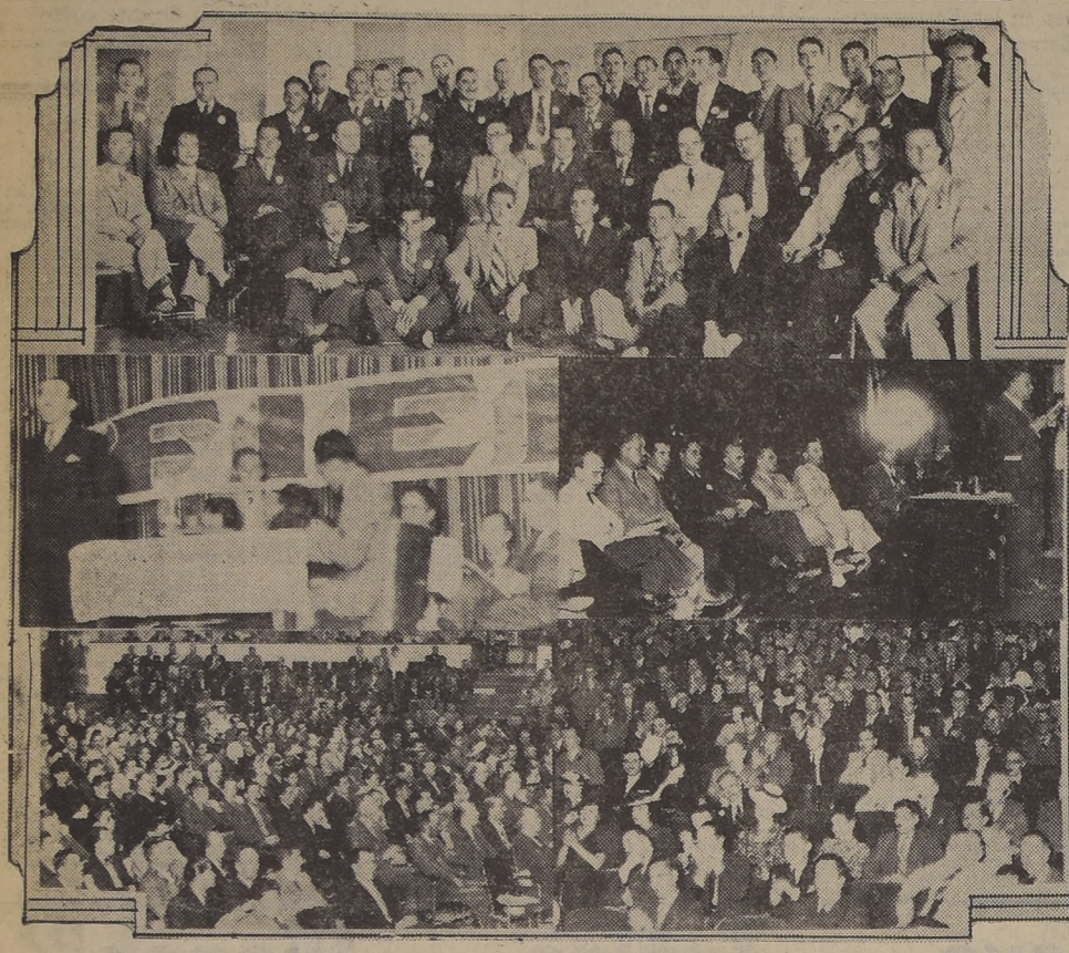
En primer término, asistentes al banquete ofrecido en el Eplanade, por la Confederación Nacional de Empleados Particulares, en honor de las delegaciones de provincias. En segundo término, las directivas de las concentraciones efectuadas en los Teatros Caupulicán y Victoria, respectivamente. Abajo, en primer término, público asistente a la concentración organizada por la Federación de Instituciones de EE. PP., y en segundo término, público asistente a la concentración de la Conep.

Se acordó pedir al Gobierno la suma urgencia. — Miles de empleados concurrieron a las reuniones de los Teatros Caupulicán y Victoria. — Las conclusiones EL MINISTRO DE SALUBRIDAD EXPUSO LA LABOR DESARROLLADA POR EL GOBIERNO EN BENEFICIO DE LOS EMPLEADOS PARTICULARES