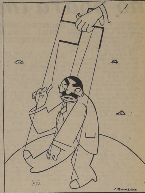
LAVAL. — Así entiendo yo la colaboración franco-alemana.