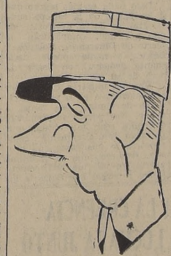
General de Gaulle

Observadores más sutiles, volviendo a Laval, creen que éste, lejos de pensar en entregar Francia entera a los alemanes, piensa buscar su colaboración para llegar a ocupar en el Eje el lugar de Italo, lo que no parece despojado de realidad.