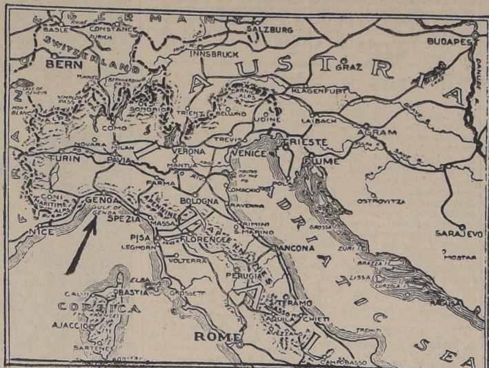
Unidades de la flota británica del Mediterráneo realizaron un sorpresivo y audaz ataque contra los objetivos militares del puerto italiano de Génova (indicado por la flecha). Esta incursión es una clara demostración de poder naval de Inglaterra